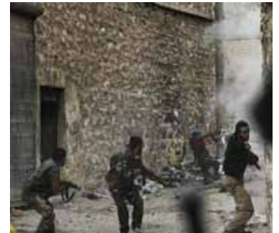
الاشتباكات في المرج

تواصل الاشتباكات العنيفة بين فصائل المعارضة وقوات النظام على جبهات منطقة المرج بالغطوة الشرقية، لاسيما في محيط بلدة ومطار مرج السلطان، حيث أكد ناشطون استعادة مقاتلي المعارضة السيطرة على عدة مزارع بمحيط البلدة من بينها مزارع حرسنا القنطرة، إضافة إلى مقتل نحو 30 عنصراً لقوات النظام إثر عملية مباغتة وصفت «بالانغماسية» شنتها عدد من الكتائب على نقاط تمرکز القوات الحكومية في المنطقة. من جهة أخرى استهدف مقاتلو المعارضة معازل قوات النظام على محاور مدينة عربين بقذائف المدفعية ما أسفر عن عديد الإصابات في صفوفها وفق ما أكده ناشطون ميدانيون، فيما ردّ الثاني باستهداف أطراف المدينة بقذائف الهاون، تزامناً مع قصف بصواريخ أرض - أرض تعرّضت له مدينة زبدین ما أدى إلى مقتل طفل وجرح خمسة آخرين. بالمقابل أفاد ناشطون إعلاميون من جنوب العاصمة باندلاع اشتباكات متقطعة بين جبهة النصرة من جهة وقوات النظام وميليشيات فلسطينية مساندة لها من جهة أخرى، وذلك على أطراف مخيم اليرموك للاجئين الفلسطينيين وسط قصف مدفعي على المنطقة.