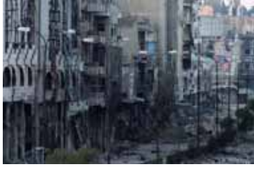
حصار معضمية الشام مستمر منذ 2013

في التهجير القسري والتغيير الديمغرافي لمحيط العاصمة، على حد ذكر البيان الذي أضاف أن نحو 45 ألف مدني نصفهم من النساء والأطفال في مدينة المعضمية يرزحون تحت حصار خانق منذ عام 2013، تفرضه قوات الأسد التي تمنع دخول أية مواد غذائية، أو طبية بشكل كامل، كما قامت برفع السواتر الترابية حول المدينة وذلك بالتزامن مع قصفها بالبراميل المتفجرة، والأسلحة الثقيلة في خرق للهدنة الموقعة مع أهالي المدينة برعاية من فريق المبعوث الأممي إلى سورية في دمشق.