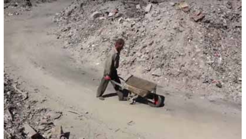
من أعمال المجلس المحلي لتحويل النفائات إلى سماذ عضوي

يعمل المجلس المحلي في مدينة دوما جاهداً بغية إيجاد حلول مبتكرة تتصدى لظروف الحصار ومعالجة الأضرار الناجمة عنه، كان آخرها إيجاد حل للمشاكل البيئية والصحية الناجمة عن عدم تمكنهم من توفير مكبات نفائات إضافية للمدينة، وعدم قدرتهم على التخلص منها، وقد قام المجلس بإيجاد طريقة للاستفادة من هذه النفائات، عن طريق تحويلها لسماذ عضوي، يستخدم كبديل عن الأسمدة الكيماوية المفقودة لدى مزارعي المدينة.