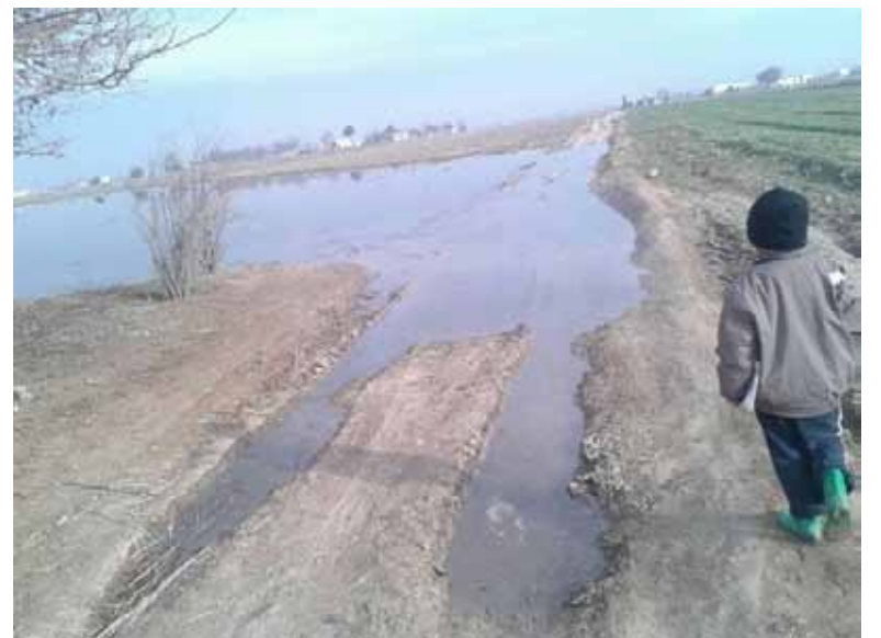
بعض القرى والأراضي الزراعية التي غمرها الطوفان الأسبوع الماضي | الانترنت