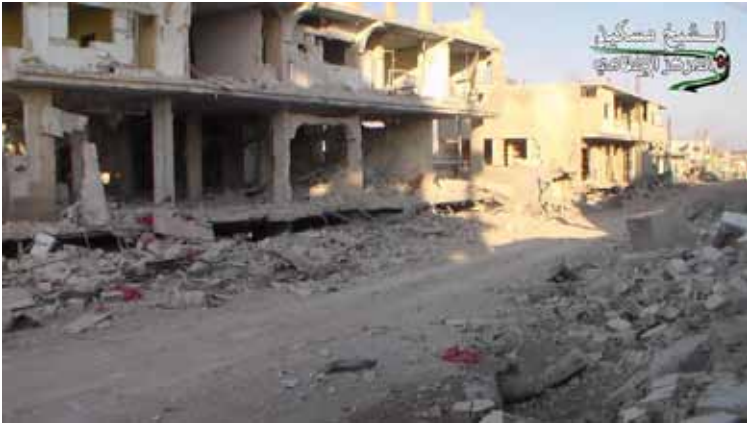
آثار القصف على الشيخ مسكين | المركز الإعلامي في المدينة

شهدت محافظة درعا جنوب البلاد تطورات ميدانية متسارعة خلال الأسبوع الماضي، حيث اندلعت اشتباكات عنيفة على أطراف بلدة الشيخ مسكين إثر هجوم مباغت لقوات النظام والميليشيات المساندة مدعومة بغطاء جوي روسي تمكنت خلاله القوات المهاجمة من السيطرة لساعات على قيادة اللواء 82 والمسكن العسكرية شرق البلدة قبل أن تستعيد فصائل المعارضة المسلحة السيطرة على عديد النقاط التي تقدمت إليها قوات النظام. ناشطون من المدينة أكدوا أن المهاجمين تكبدوا خسائر كبيرة في الأرواح والعتاد، موضحين أن الاشتباكات أدت إلى مقتل قياديين من الحرس الثوري الإيراني أحدهم يدعى «غدير عليين» مسؤول التنسيق والارتباط في مركز عمليات إزرع، إضافة إلى مقتل قائد الحملة المقدم «حسان العلي» من مرتبات الفرقة الخامسة ومقتل عمار العبدالله المسؤول عن حاجز الفقيع. التطورات الميدانية على جبهة الشيخ مسكين تزامنت مع اشتباكات عنيفة بين مقاتلي المعارضة وقوات النظام على أطراف حي المنشية المحرر داخل درعا المدينة.