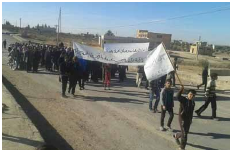
من المظاهرات في ريف حلب ضد وحدات حماية الشعب

في المنطقة هو ما دفع أغلب أهالي القرى العربية للمشاركة بالمظاهرات، وبحسب شباط فإن المتظاهرين تجمعوا في تلك القرى بالتنسيق فيما بينهم، لتضم المظاهرات المئات من السكان الذين يطالبون بالدرجة الأولى بإطلاق سراح المعتقلين في سجون وحدات حماية الشعب التابعة لحزب الاتحاد الديمقراطي الكردي.