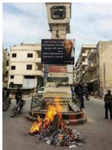
ساحة الصومعة في جسر الشغور

أوضح ناشط إعلامي من محافظة إدلب، فضل عدم الكشف عن اسمه، أن المكتب الدعوي التابع لجبهة النصر، نشط مؤخراً بشكل واضح، ويعمل على محاربة أي فكر ديمقراطي، ويحض على معادات السياسيين والهيئات السياسية التي تطالب بمجتمع مدني، ويقول الناشط: «يعمل المكتب الدعوي على إيصال أفكاره من خلال خطب الجمعة، واللافطات التي ينشرها في الشوارع، ويزيد نشاطهم عند عقد أي مؤتمر سياسي لحل الأزمة السورية،