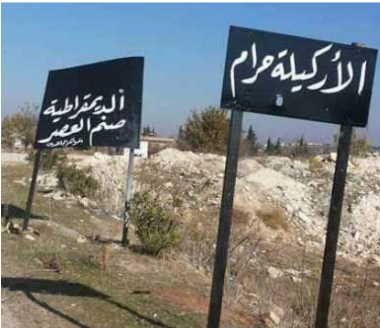
اللافطات على مدخل مدينة إدلب | سوريتنا

كتبت على بعض اللافطات أحاديث نبوية، وآيات قرآنية، ذات مضمون جهادي، وكتبت إلى جانبها عبارات تحث على الجهاد، وأخرى تبيّن المحرمات وترافقها تفسيرات، لنهي الناس عن بعض الممارسات، كتبرج النساء، ومنع الرجال من حلق اللحية.