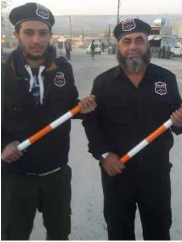
عناصر من الشرطة الإسلامية في إدلب