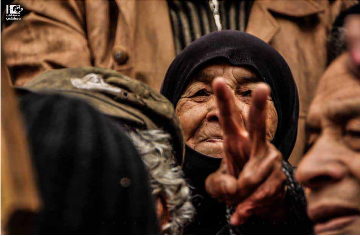
صورة العام 2015 من عدسة شاب دمشقي | جنوب دمشق - مخيم اليرموك