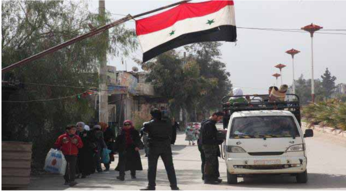
أحد حواجز النظام في مدينة حلب

تختلف المبالغ التي يطلبها عناصر الحواجز من الركاب، تبعاً لمكان وجودها، فالحاجزان الموجودان في منطقة الراموسة، وهما أول النقاط العسكرية التي تواجه المسافرين عند خروجهم من حلب، يطلبان مبالغ بسيطة لا تتعدى 200 ليرة من بعض الشبان المسافرين إلى مناطق خارجة عن سيطرة النظام، وفي غالب الأحيان يأخذون المال من السائق مباشرة دون التعرض للركاب، ثم يواجه المسافر خمسة حواجز متشابهة في طريقة التعامل، والتي تنتشر في ثلاثة مناطق: هي خناصر والسفيرة وأخرها في السلمية، وأحد هذه الحواجز تابع للشرطة العسكرية، والبقية يتبعون للدفاع الوطني، وعند وقوف المسافرين المتجهين إلى مناطق خارجة عن سيطرة النظام، يقوم عناصر الحاجز بإزالة الشبان من الحافلة، ويطلبون هوياتهم ويلفون الأتوم لبعضهم بغية إخافتهم، ثم يأتي العنصر الذي يأخذ دور العسكري المنفذ ويعرض على الشبان حل المشكلة عن طريق دفعهم المال، وغالباً تنتهي المفاوضات بدفع كل شاب مبلغ 500 ليرة سورية على أقل تقدير، وفق مسافرين على هذا الطريق.