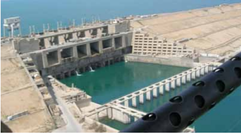
سد تشرين على ضفاف البحيرة