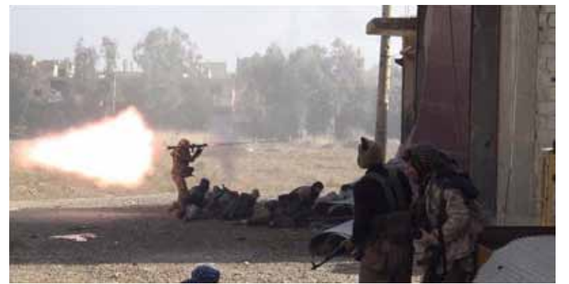
من معارك حي الصناعة في دير الزور | إعلام التنظيم

تمكن تنظيم الدولة الإسلامية خلال الأيام الماضية من السيطرة على أحياء جديدة داخل مدينة دير الزور، إثر اشتباكات مستمرة مع قوات النظام أسفرت عن سقوط قتلى وجرحى من الطرفين، في ظل قصف مكثف من قبل طيران النظام والطيران الروسي تسبب بسقوط قتلى وجرحى بين صفوف المدنيين.