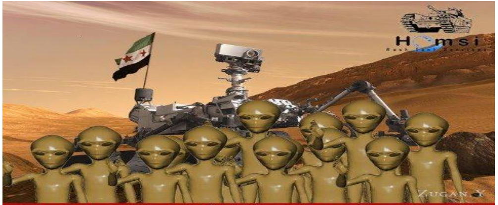
كتيبة مغاوير المريخ تعلن استيلائها على مركبة "كيوركسني" وترفع عليها علم الثورة السورية و ذلك ضمن مخطط المؤامرة الكونية التي خيكها أمريكا و إسرائيل و مخلوقات من مجرات وكويكبات فلكية مختلفة.

فقد أفاد الناطق باسم حكومة كوكب المريخ (ياماما مريخكو) عن دهشته من زج كوكبه في الصراع الدائر في سوريا ، كما أنه نفى وبشكل قاطع أن يكون لحكومته أي صلة في القضية السورية ، مؤكداً أن القضية السورية قضية شعب ، وأن الأسد يجب عليه أن يرحل ، وهو يحاول إلصاق التهم جزافاً بالآخرين من أجل البقاء في سدة الحكم في سوريا .