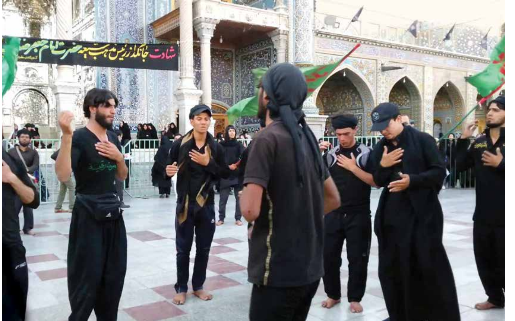
غزو منظم لدمشق بعائلات شيوعية وتمويل إيراني (الإنترنت)

ما تفعله إيران من تملكها لعقارات عامة أو خاصة في دمشق وضواحيها وفي مناطق مختلفة من سوريا، يظهر مدى التغلغل الإيراني ليس في السياسة السورية فحسب، بل في أرضها ومكونات شعبيها أيضاً، تحسباً لأسوأ سيناريو قد تواجهه إيران جراء سقوط محتمل ووشيك لنظام الأسد. الأمر الذي دعاها للحيطه والحذر وتعزيز ما في جعبتها من أوراق ثبوتية تتعلق بحقوق الملكية القانونية يستحيل شطبها، ملكية تحميها القوانين المحلية والأعراف الدولية، فلا يلغى هذه القوانين إلا عودة الحقوق لأصحابها.