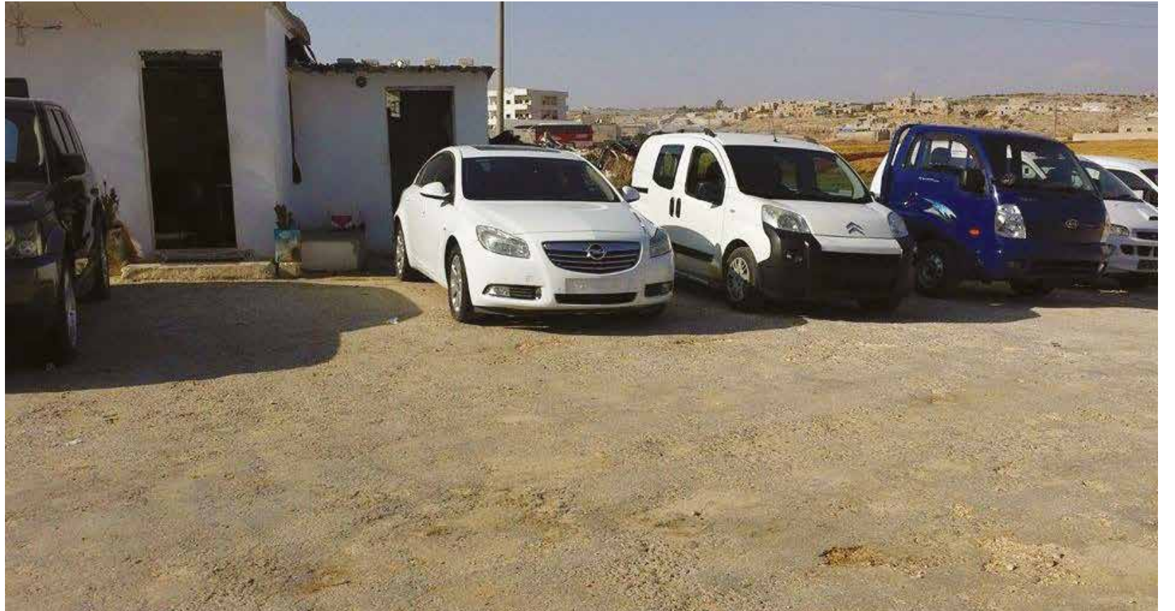
ماتزال السيارات التركية غير مألوفة عند الميكانيكيين السوريين، وتكثر أعطالها بسبب الديزل غير المصفى بشكل جيد (خاص - صدى الشام)

تشهد بلدة سرمداء القريبة من معبر باب الهوى، نشاطا كبيرا في تجارة السيارات المهربة، حيث تعتبر البلدة الصغيرة الواقعة في شمال محافظة إدلب، المركز التجاري الأكبر في الشمال السوري، خاصة بعد إغلاق معبري تل أبيب وجرابلس مع تركيا، وحالة عدم الاستقرار الأمني في معبر باب السلامة بسبب الاشتباكات القريبة مع تنظيم داعش، مما جعل معبر باب الهوى وسوق بلدة سرمداء المركز الأكبر للتبادل التجاري في شمال سوريا، وعلى وجه الخصوص تجارة السيارات.