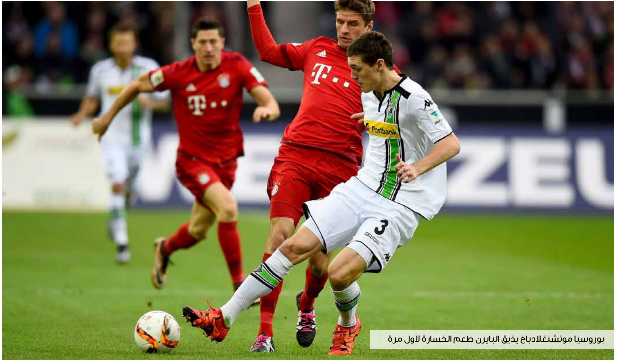
بوروسيا مونشنغلادباخ يذيق البايرن طعم الخسارة لأول مرة

حلت لجنة المتصدر كالأضيق الثقيل على متصدرى كافة البطولات الأوروبية الكبرى، فخر متصدرو الدوري الإنكليزي والإيطالي والألماني، وتعادل برشلونة وباريس سان جيرمان في مرحلة منتصف الأسبوع بالنسبة للأخير، ما غير كثيرا في جدول ترتيب بطولات إنكلترا وإيطاليا، بينما اشتعلت المنافسة في إسبانيا وألمانيا.