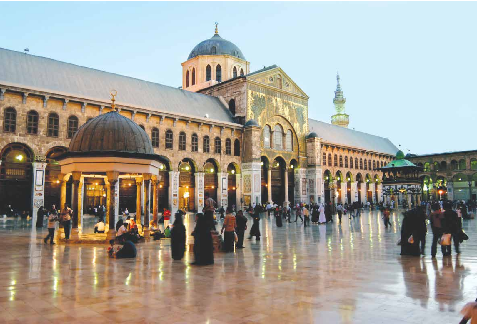
عاصمة الأمويين في مرمى إيران

منذ قيام الثورة الإيرانية ضد الشاه، سعت إيران للسيطرة على سوريا اقتصادياً وعسكرياً عبر نشر التشيع، ليكون لها عملاء في المنطقة العربية تحركهم كبيادق لها في رقعة الشطرنج. وبعد قيام الثورة السورية، سقط آخر قنص لإيران، لتتوضح نواياها الحقيقية في تغيير التركيبة الديموغرافية للعاصمة دمشق ذات الأغلبية السنية، ولتستقدم بدلاً عنهم مرتزقة شيعة مع عائلاتهم من كل بقاع الدنيا، ويستوطنوا في عاصمة الأمويين. وتشير الوقائع على الأرض إلى أن إيران استحوذت على نسبة ٢٠٪ من مساحة دمشق، عبر شراء عقارات لفنادق ومنازل وأراضٍ في قلب العاصمة وضواحيها.