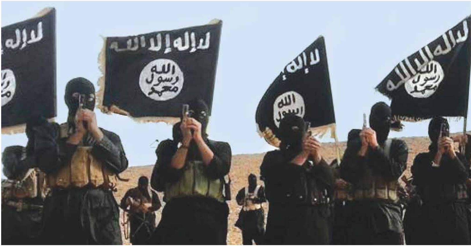
داعش... حصان طروادة الجديد (الإنترنت)