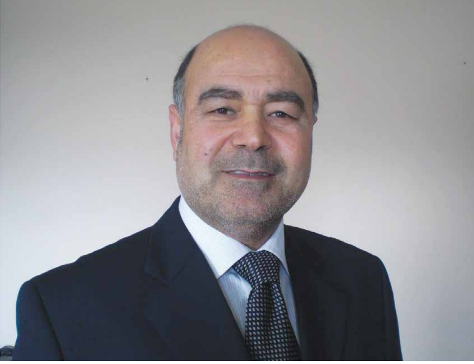
جمال قارصلي: عضو المكتب السياسي في الجمعية الوطنية السورية، والعضو السابق في البرلمان الألماني

قارصلي: الطائفة العلوية هي مكون أصيل وأساسي للمجتمع السوري، إلا أن أبناءها رهائن بيد النظام.