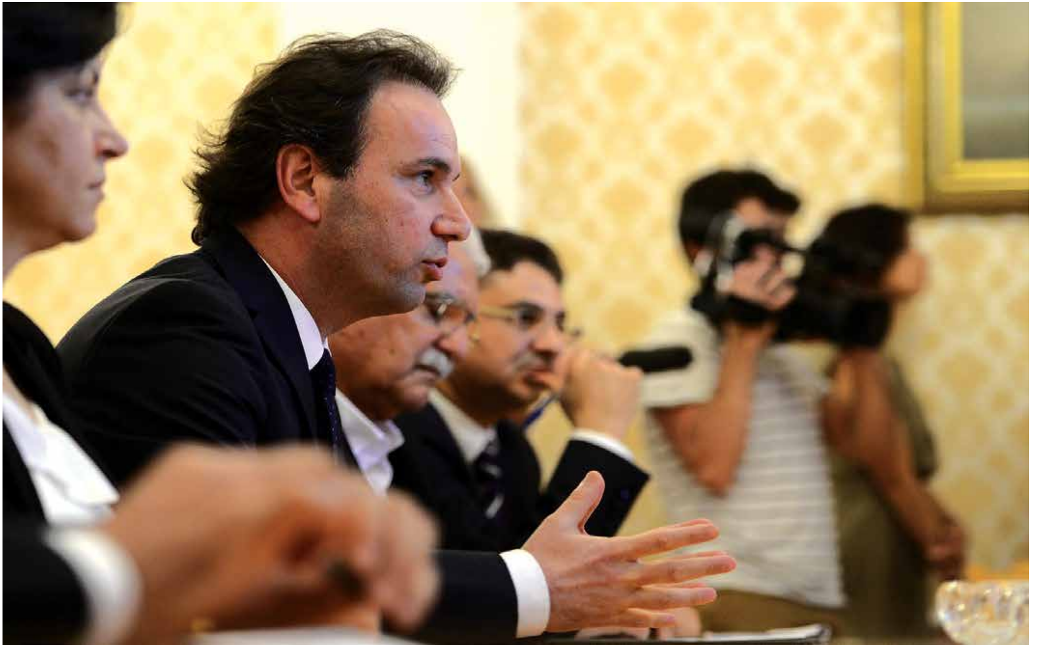
الاتلاف السوري يحضر بـ ٣٨ عضواً في مؤتمّر الرياض