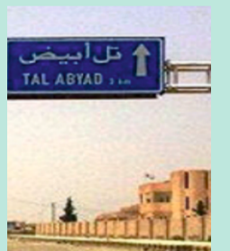
كانتون تل أبيب ص ٣