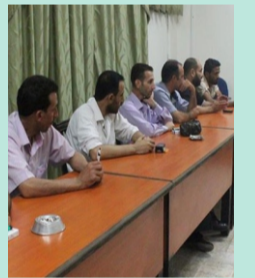
إشكالية المجالس المحلية ص ٢