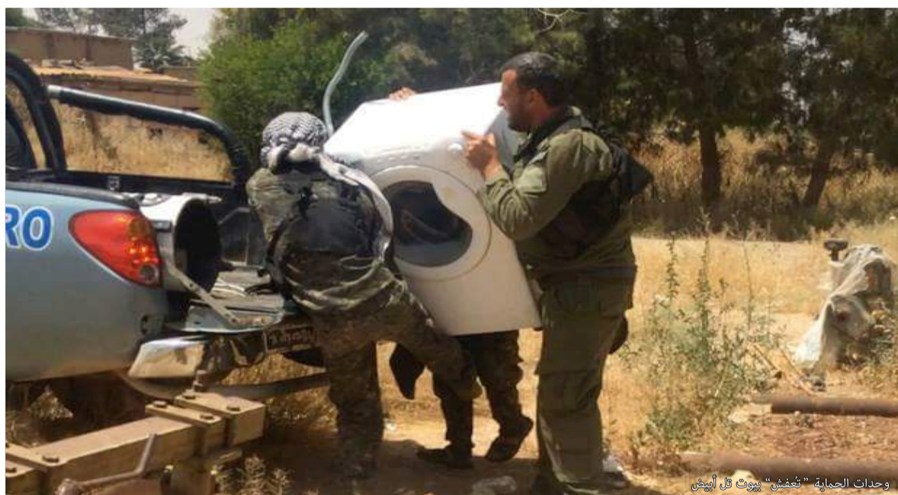
وحدات الحماية "تفشي" بيوت تل أبيض

وأرجح أن يكون سبب رفع علم الثورة (إعلامياً) في الإدارة "الوهمية" في تل أبيض، خاصة بعد ممارسات التهجير ضد السكان في تل أبيض، والتي أحدثت ضجة إعلامية شديدة، خاصة بعد نشر تقارير دولية ومحلية تؤكد حدوثها، وأخرى صادرة عن قوى المعارضة السورية تثبت تهجير عراقي للعرب والتركماني، الأمر الذي يحاول حزب الاتحاد الديمقراطي نفيه، ونفي أي مشروع قومي له ليكون مبرراً للتهجير العرقي، لذلك يقوم برفع علم الثورة في عدة لقاءات يجريها إعلامهم مع من يتم تسميتهم (بقوات بركان الفرات) والذي تدعي الإدارة الذاتية بأنهم جيش