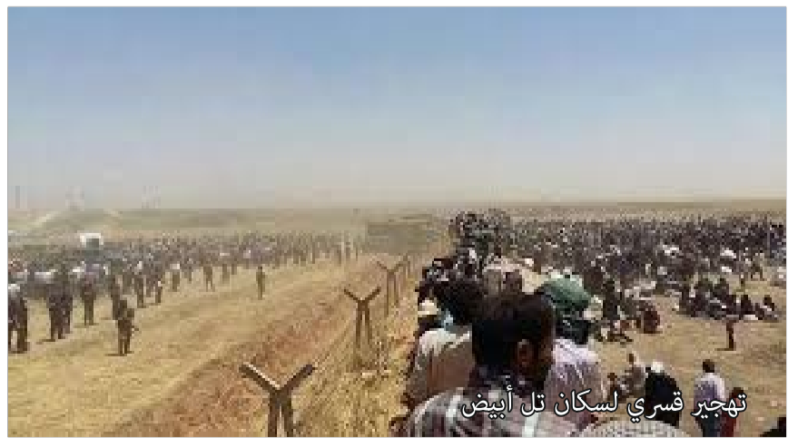
تهجير قسري لسكان تل أبيض

ويشمل التقرير الذي أعده فريق من المنظمة، زار ١٤ قرية وقضاء، صوراً ملتقطة من الأعمار الصناعية، وشهادات سكان محليين وشهود عيان، حيث تظهر الصور الملتقطة في حزيران