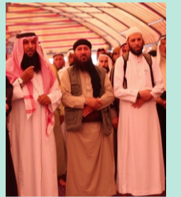
إنزباج تحت حد السيف ص ٦