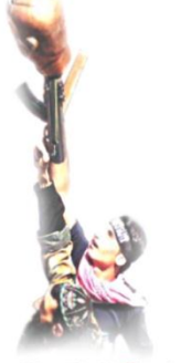
ثورة العالم الحر