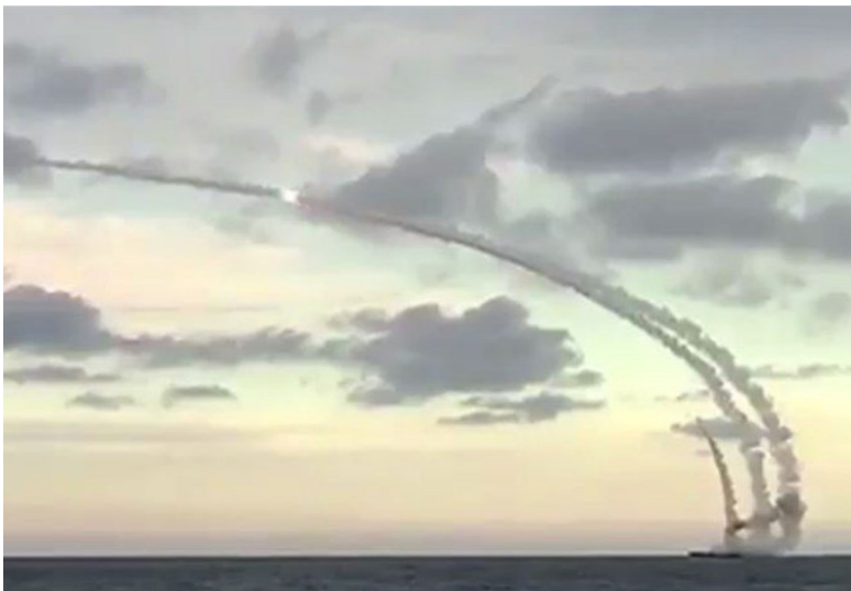
صواريخ باليستية عابرة للقارات تطلقها روسيا على سوريا من بحر قزوين

روسية أن روسيا أدخلت قاذفات الصواريخ الاستراتيجية «توبوليف ١٦٠»، و«توبوليف-٩٥ إم إس»، و«توبوليف ٢٢» في العمليات العسكرية في سوريا حسب وزير الدفاع الروسي سيرغي شويغو، الطائرات الروسية العملاقة من نوع «توبوليف ١٦٠»، و«توبوليف-٩٥ إم إس»، و«توبوليف ٢٢» هي قاذفة تقابل استراتيجية ضخمة ذات أربع محركات من تصميم مكتب توبوليف في الإتحاد السوفيتي، تم صنعها بأمر من ستالين، دخلت الخدمة في عام ١٩٥٦ وما زالت تخدم في القوات الجوية الروسية حتى الآن ويتوقع أن تظل في الخدمة حتى عام ٢٠٤٠.