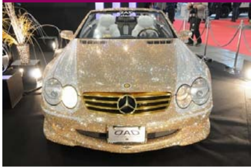
Otombêl Mersîdês SL600 bi Elmas'ê hatiye xemlandin ku xwediyê wê

kesekî Erebestan a Siûdî ye û buhayê wê otombêlê nêzikî 5 Milyon Dolar in.