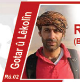
Rewşenbîr (Behaneyin Taybet)