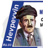
Mihemedê Cemilê Seyda Cara Yokem e Ku Hûn Vê Hevpeyvinê Dixwînin