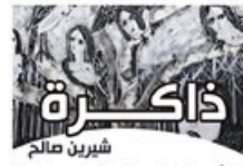
شهرين صالح ذاكرة

الأصفاة في توجالمه ليلاً ينفون على مجازات الحب بعيداً، ثني على الحاضر وغموض في وتورة التذكر واستحضار أرواح من غلوا.