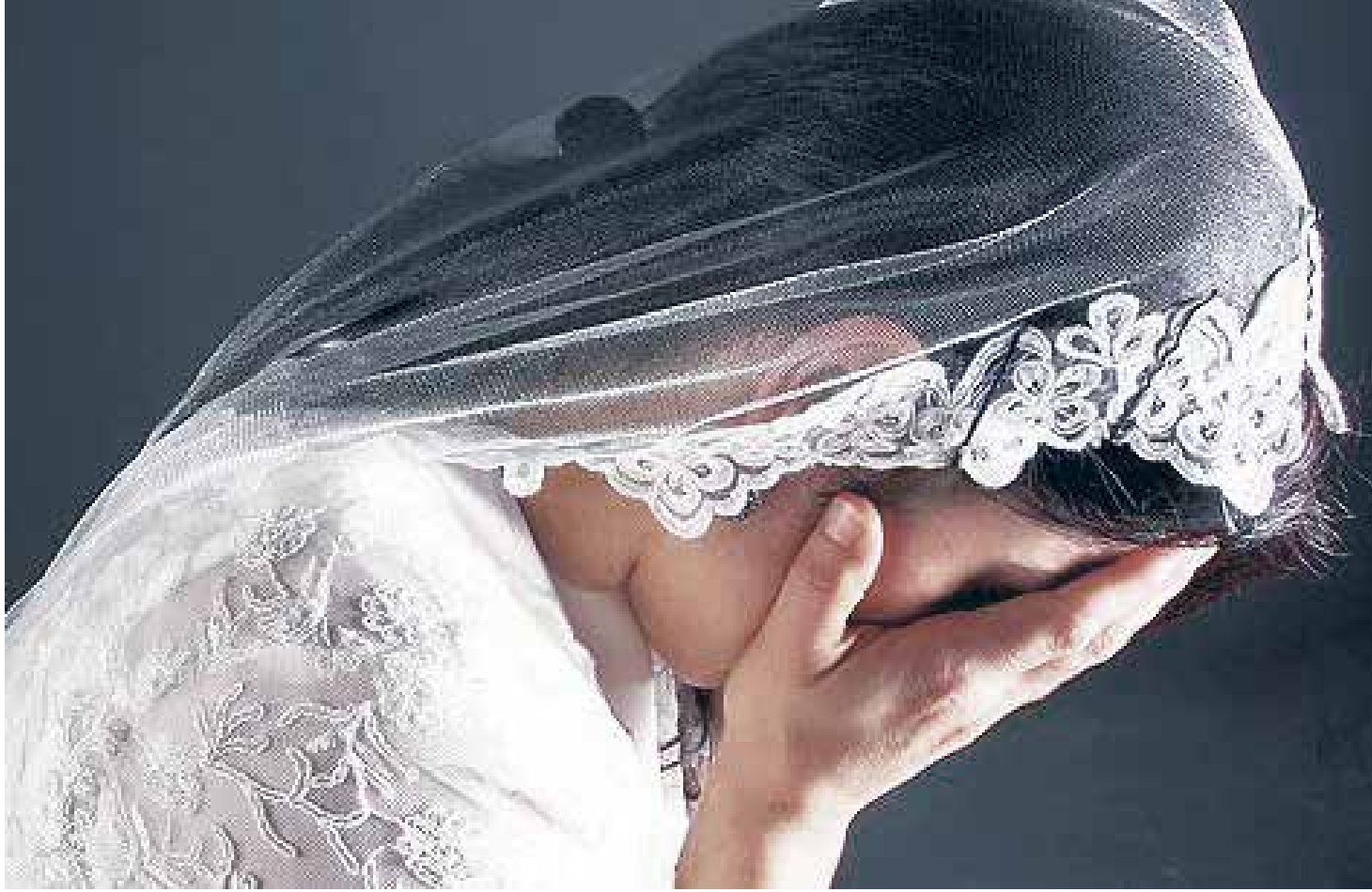
يحمل زواج القاصرات آثاراً مدمرة على نفسيات الضحايا (الصورة تعبيرية)