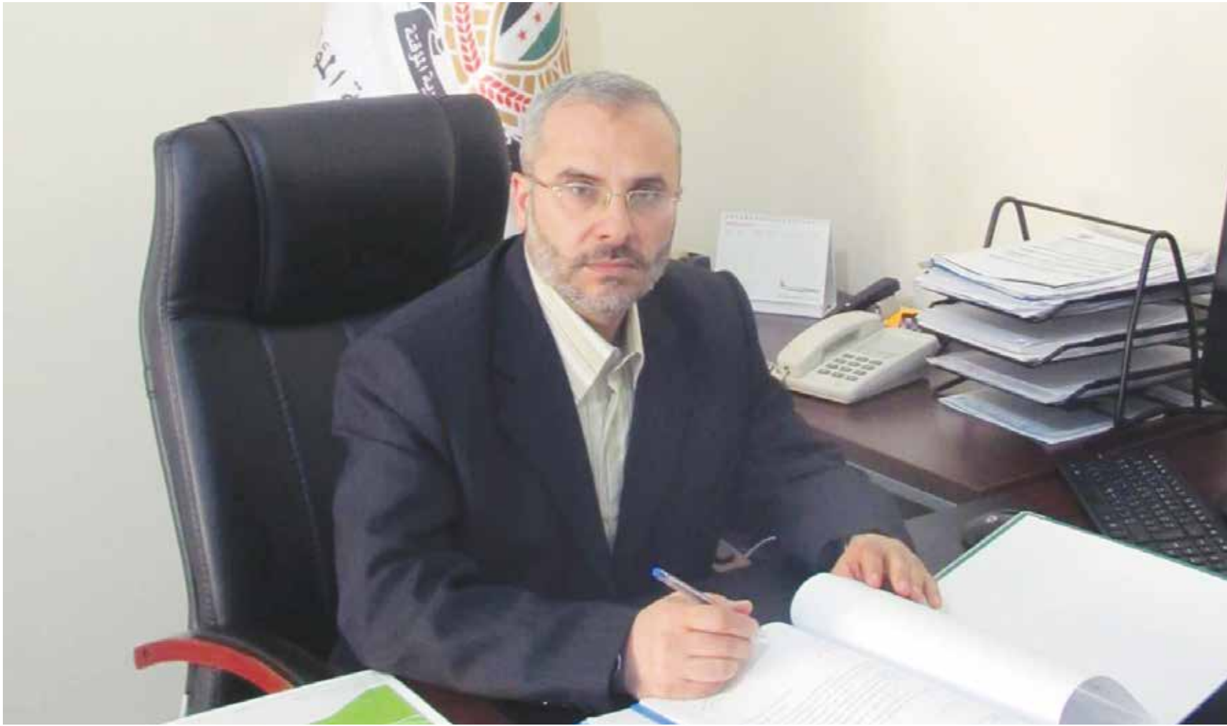
معاون وزير الطاقة والثروة المعدنية في الحكومة السورية المؤقتة عبد القادر علاف