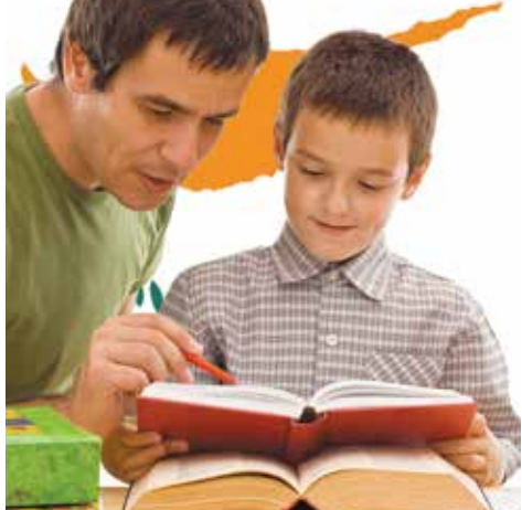
أجب بصدق عن تساؤلات طفلك

يمكن لأهل أو الأقارب أو المعارف إنقاذ الطفل، أو مجموعة من الأطفال، من الانقطاع أو التأخر عن التعليم، باتباع خطوات بسيطة لتعليمه منزلياً، تؤهله للالتحاق بالمدرسة المناسبة حين تتاح له الفرصة أو تغيير الظروف.