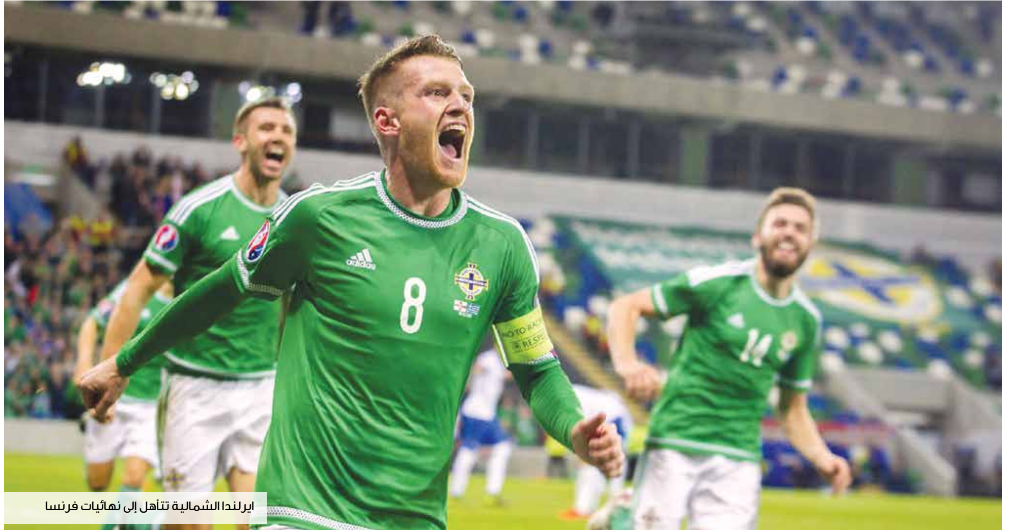
إيرلندا الشمالية تتأهل إلى نهائيات فرنسا