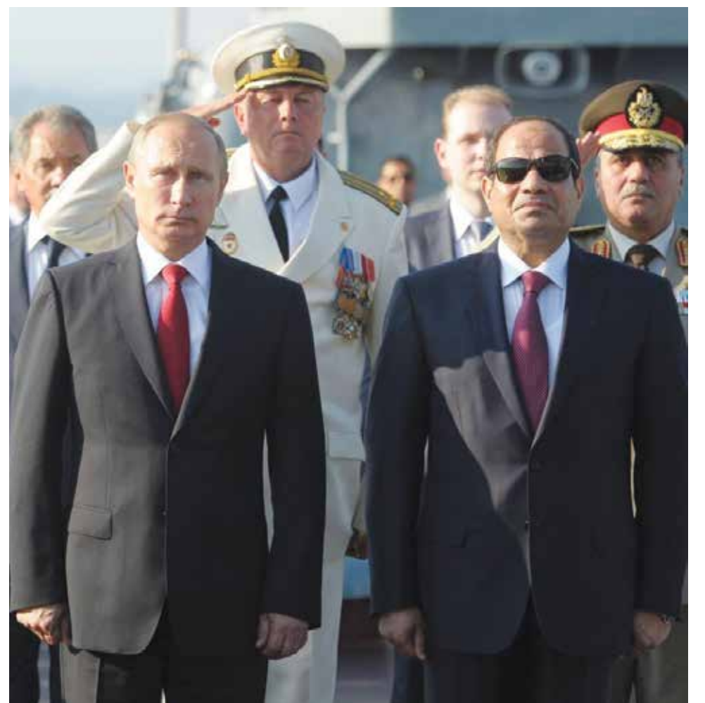
مصر تصفق للغزو الروسي لسوريا.. فما الذي ستجده فيما بعد؟؟؟ (الانترنت)

هذا تطور جديد في مسار الثورة وتعامل الأنظمة العربية معه. هذه فرصة -لا تدوم طويلاً- لتكون تلك الأنظمة شريكا في صناعة تغيير تاريخي يفتح أمامها وأمام سائر بلادنا وشعوبنا وشعوب العالم أبواب التحرر والتقدم.. وهي أيضاً مسؤولية كبيرة، ومسؤولية التحرك والتصرف أو الخلود للأرض في مواجهة خطر عني كبير، يعرهد في سورية الآن، وقابل للانتشار في سواها قريباً.. أنذاك لن تكون البلدان العربية الأخرى في منأى عن تبعاته، سيان ما هو اللون الذي يحمل كل منها اليوم، مقابل نقاء لون "الثورة الكاشفة" المستهدفة أكثر من سواها.