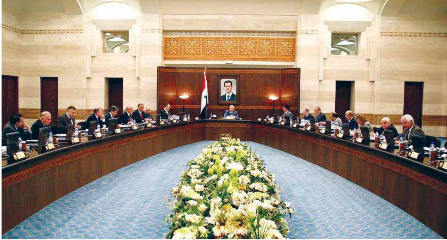
عندما تتحول الحكومة إلى دمي.. تتحول الدولة إلى فاشلة

منذ اغتصاب عائلة الأسد للسلطة في سورية، بدأت التحولات الجذرية السلبية في بنية البلد السياسية والثقافية والاجتماعية والاقتصادية، تشق طريقها لتحويل سورية من بلد عريق قائم على أسس وثقافة سياسية ديمقراطية، إلى بلد هش يعاني سياسياً واقتصادياً واجتماعياً، بعد أن حولت عائلة الأسد والمقرين منها، البلد إلى مزرعة يديرونها عبر أجهزةهم الأمنية الطائفية، التي تغلغلت واحتكرت أغلب المراكز القيادية المهمة في الأمن والجيش، وأمست البلاد بقبضة من حديد، وتلاعبت بمصير شعب كامل ذاق كل أنواع المأساة، وحولت معها سورية إلى دولة هشة وضعيفة بالمعنى السياسي والاجتماعي والمؤسساتي.