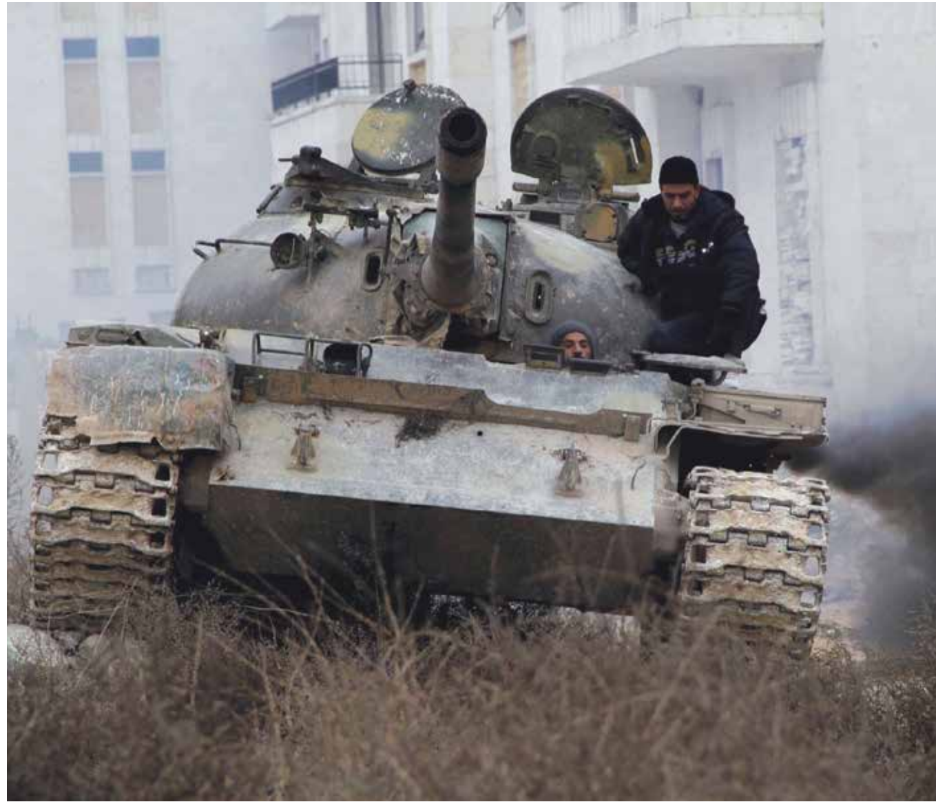
قوات المعارضة تستولي على عدد من الدبابات في كفرنبوذة وتدمر أكثر من ٤٠ دبابة ومدركة خلال أسبوع

«بعد نحو أسبوع على حملة النظام مدعوماً بغطاء جوي على ريف حماة الشمالي، تبعتها هجومات على ريف اللاذقية بهدف إنهاء وجود قوات المعارضة في الساحل، يمكن القول إن النظام تلقى ضربة قاصمة في الشمال، خصوصاً مع خسارته لعشرات الآليات والدبابات في الريف الحموي فيما اصطاح تسميته بـ «مجزرة الدبابات»، فضلاً عن إسقاط طائرتين حربيّتين، في حين لم يكن بالحسبان أن تقلب المعارضة معطيات المعادلة في الساحل، وتتحوّل من الدفاع إلى الهجوم، فبدلاً من دخول النظام إلى بلدة سلمى وضمان تلال جب الأحمر الاستراتيجية، سيطرت فصائل المعارضة على قرية جورين التي تؤمن سلمى، على أن الوضع وإن بدا يسير لصالح الأخيرة في حماة واللاذقية، إلا أن الواقع في مدينة حلب ينذر بوضع كارثي، مع سيطرة تنظيم «الدولة الإسلامية» على مدرسة المشاة والمواقع المحيطة بها، لتصبح المدينة مهددة من التنظيم وقوات النظام ووحدات حماية الشعب الكردية»