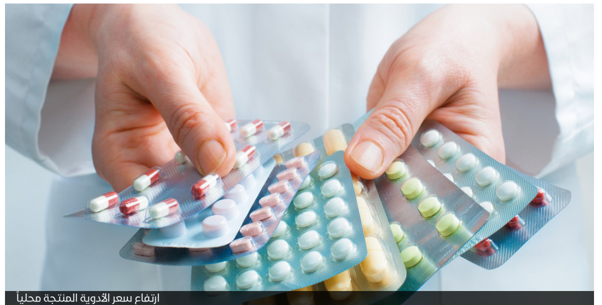
ارتفاع سعر الأدوية المنتجة محلياً

تتوالى الضغوطات على المواطن السوري منذ اندلاع الثورة في سوريا وإلى يومنا هذا، وتتنوع هذه الضغوطات بين قصف وقتل واعتقال وحصار وارتفاع في الأسعار وغيرها من الإهزاعات التي تشهدها الساحة السورية، وكغيرها من الأخبار المحزنة التي يتلقها المواطن السوري بشكل شبه يومي جاء خبر ارتفاع سعر الأدوية في سوريا ليضاف إلى قائمة الضروريات التي يعجز المواطن السوري عن تأمينها. إذ أصدرت وزارة الصحة خلال الأيام الماضية قراراً ترفع بموجبه سعر الأدوية المنتجة محلياً بنسبة ٥٠٪، كما رفعت هامش ربح الصيدلي بنسبة ٢٥٪، أما بالنسبة للأصناف الدوائية الجديدة فسيتمتع سعرها على احتساب كلفة المواد الأولية لها بناء على سعر صرف العملات الأجنبية