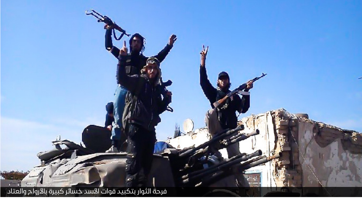
فرحة الثوار بتكبيد قوات الأسد خسائر كبيرة بالأرواح والعتاد

كما تحتوي الإدارة على مستودعات أسلحة كبيرة، وفيها راجمات صواريخ ودبابات وأسلحة ثقيلة يستهدف من خلالها النظام