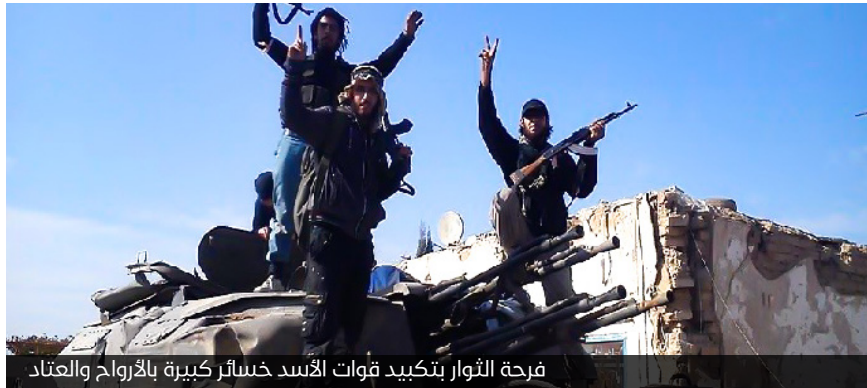
فرحة الثوار بتكبيد قوات الأسد خسائر كبيرة بالأرواح والعتاد