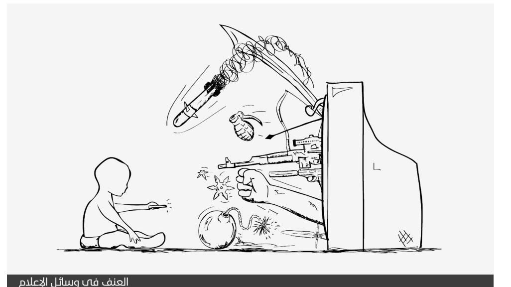
العنف في وسائل الإعلام