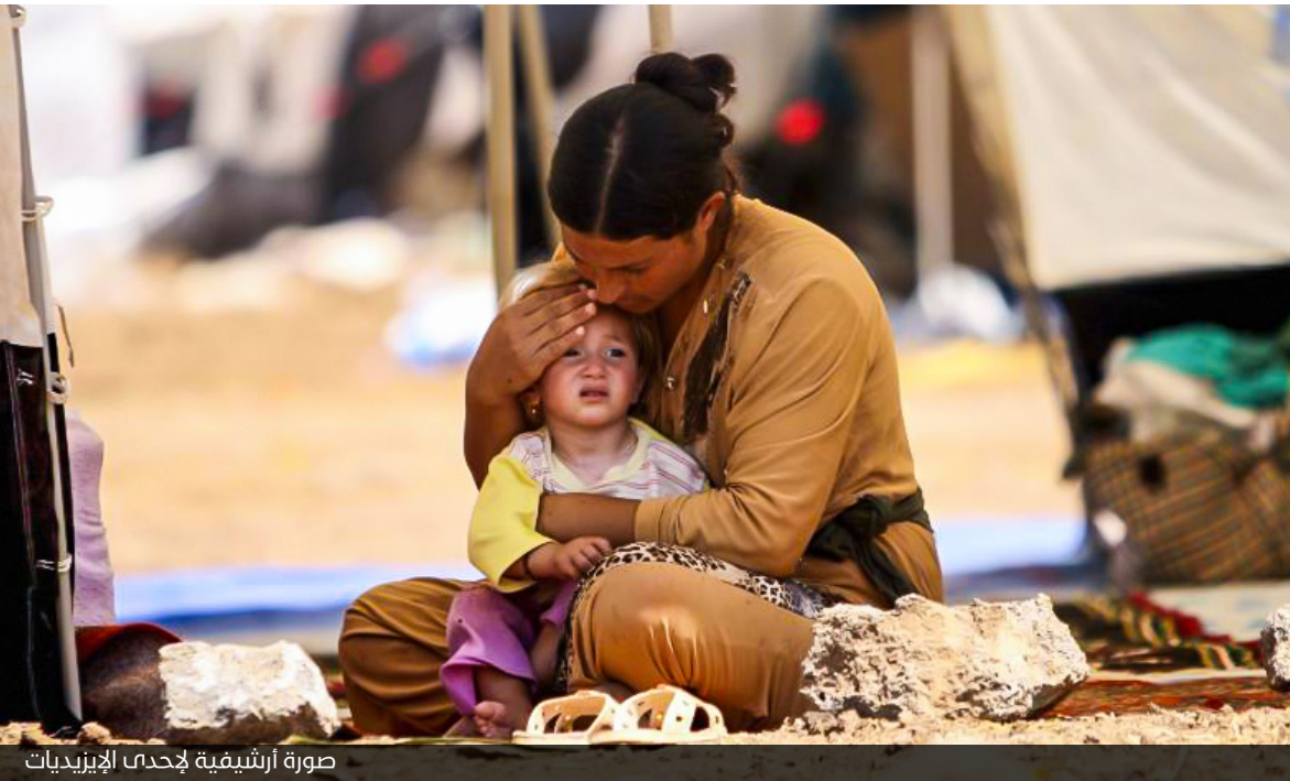
صورة أرشيفية لإحدى الإيزيديات