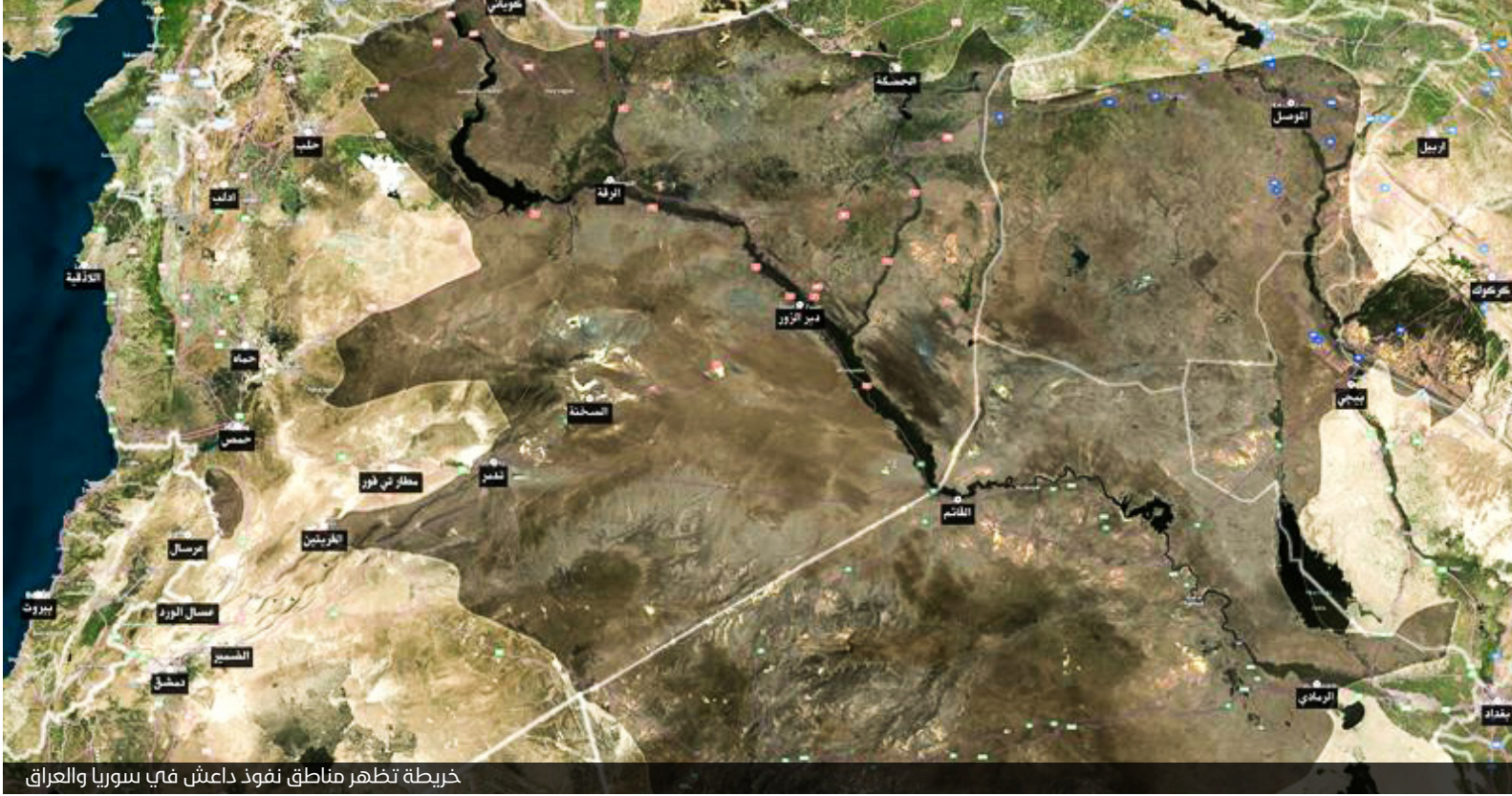
خريطة تظهر مناطق نفوذ داعش في سوريا والعراق

٥- إن قرار هجرتك العكسية -لاحقاً- من أرض يسيطر عليها التنظيم إلى أرض أخرى أمر يمكن أن تقرره بنفسك حين ترى خطر غياب الهوية الوسطية عليك وعلى أسرتك وانتشار أفكار الغلو لا سيما بين الصغار، فمما أننا مأمورون بالمحافظة على حياة أولادنا فنحن