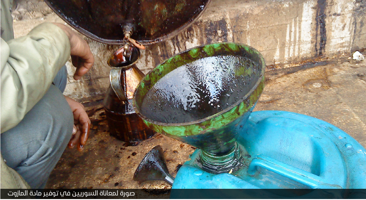
صورة لمعالجة السورين في توفير مادة المازوت

يدرك أن هذا الخطوة شكلية وأن الشبيحة هم من يبيعون البنزين للتجار وهم من يقومون بمصادرة صهاريج البنزين قبل دخولها للمدينة، ولسان حال الناس يقول "ما دام لصوص البنزين موجودين لن نُحل المشكلة". فمتى سيشتبع أولئك اللصوص برابرة العصر ويكفوا عن مصادرة اللقمة من أفواه الناس؟!