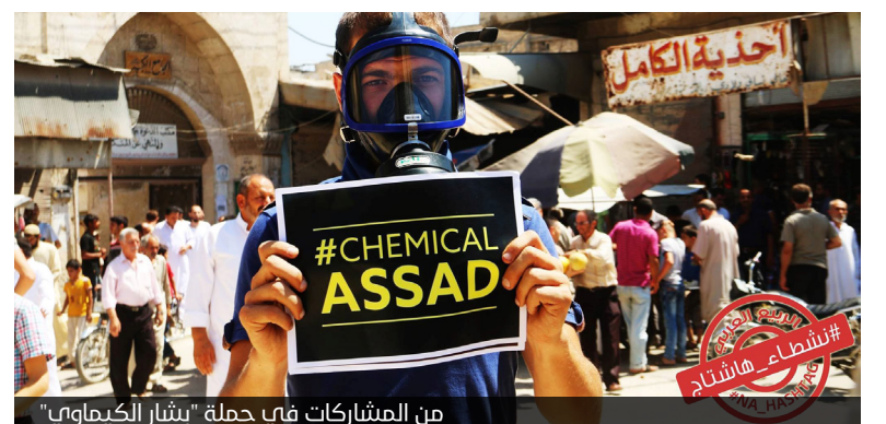
من المشاركات في حملة "بشار الكيماوي"