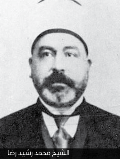
الشيخ محمد رشيد رضا

والعرفان، مثل: علم أصول الدين، علم فقه الحلال والحرام والعبادات، التاريخ، الجغرافيا، الاجتماع، الاقتصاد، التدبير المنزلي، حفظ الصحة، لغة البلاد، والخط. افتتحت المدرسة في ليلة الاحتفال بالمولد النبوي سنة ١٩١٢، غير أن المدرسة كانت بحاجة إلى إغانات كبيرة ودعم قوي، ثم جاءت الحرب العالمية لتقتضي على هذا المشروع فتعطلت الدراسة في المدرسة ولم تفتح أبوابها مرة أخرى. من أهم مؤلفاته "تفسير المنار" الذي استكمل فيه ما بدأه شيخه محمد عبده الذي توقف عند الآية (١٢٥) من سورة النساء، وواصل رشيد رضا تفسيره حتى بلغ سورة يوسف وحالت وفاته دون إتمام تفسيره. وله أيضاً: الوحي المحمدي، ونداء للجنس اللطيف، تاريخ الأستاذ الإمام والخلافة، السنة والشيعنة، حقيقة الربا، مناسك الحج، الوهابيون والحجاز. كان للشيخ رشيد روابط قوية بالملكة العربية السعودية، فسافر بالسيارة إلى السويس لتوديع الأمير سعود بن عبد العزيز بن عبد الرحمن آل سعود وزوده بنصائحه، وعاد في اليوم نفسه، وكان قد سهر أكثر الليل، فلم يتحمل جسده الواهن مشقة الطريق، ورفض المبيت في السويس للراحة، وأصر على الرجوع، وكان طول الطريق يقرأ القرآن كعادته، ثم أصابه دوار من ارتجاج السيارة، وطلب من رفيقه أن يخرج روحه الطاهرة في يوم الخميس ٢٢ آب ١٩٣٥، وكانت آخر عبارة قالها في تفسيره: "فإنسأله تعالى أن يجعل لنا خير حظ منه بالموت على الإسلام".