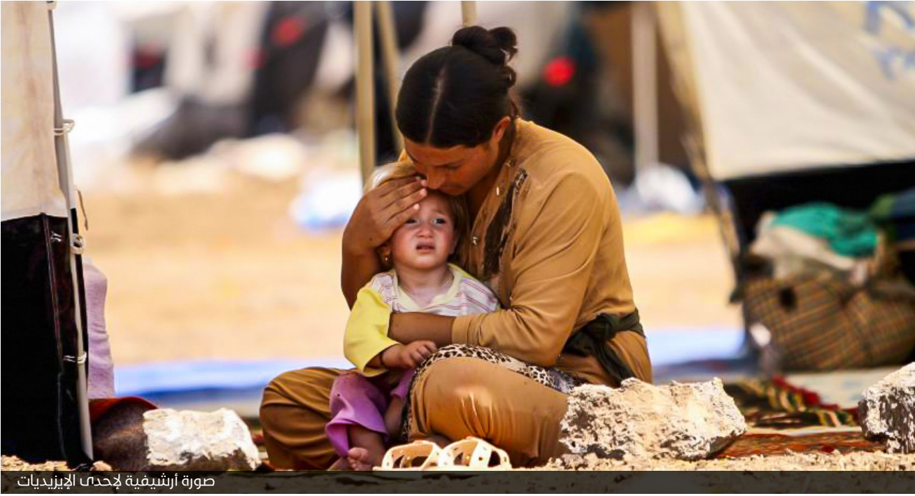
صورة أرشيفية لإحدى الإيزيديات

كان لابد أن نبهنا عن حقيقة ما يجري وبدأ السؤال ... التفاصيل صفحة ( 4 )