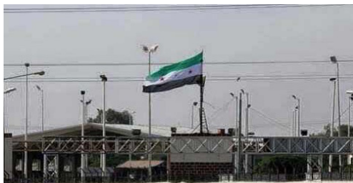
الرقعة تزخج بصمت