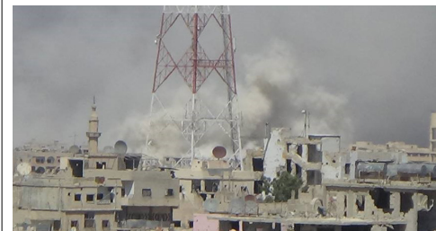
أبو الزين - درعا