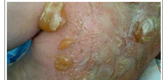
جود الخطيب - حلب