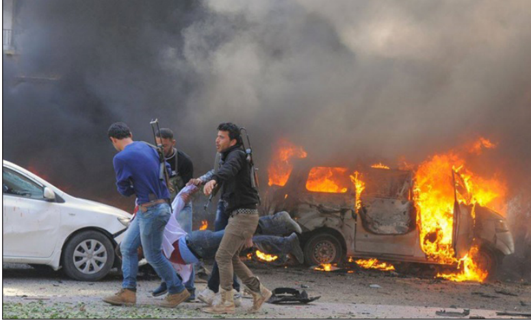
اغتيال أحد القادة العسكريين في ريف ادلب