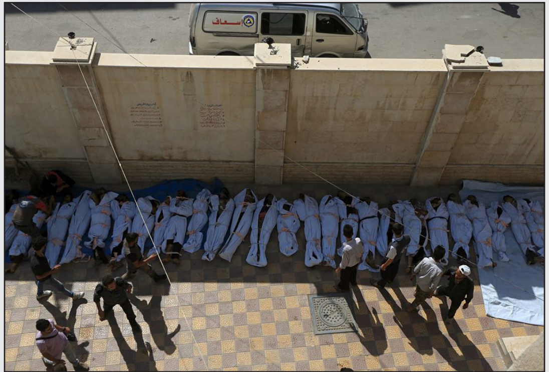
مسعفون وعناصر من الدفاع المدني يجمعون جثث قتلى سقطوا في غارات شنها طيران النظام السوري على --مدينة دوما ١٨-٨-٢٠١٥