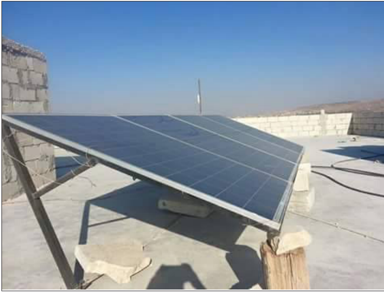
ألواح الطاقة الشمسية لتوليد الكهرباء في ريف ادلب | خاص تمدين

ظلام يخيم على مناطق واسعة من ريف إدلب المحرر، إنها الكهرباء عصب الحياة، حيث لم يعد لها أي وجود في معظم القرى والبلدات، فأصبح الشغل الشاغل لأغلب الأهالي هو إيجاد ما يغنيهم عن انقطاع دام لسنوات لأهم خدمة لا يمكن الاستغناء عنها بأي شكل من الأشكال.