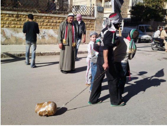
"مين قال إنو نحنا ما مندلل حيواناتنا!!؟؟ شعو الزلما آخذ حيوانو الأليف معو عالمظاهرة"

لمن يقوم بإرسال البريد الإلكتروني ولا يريد للجهة المستلمة معرفة عنوان الأبي الخاص به فيجب أن يستخدم جيميل حصراً وعبر صفحة الانترنت حصراً أي عبر www.gmail.com وليس عبر برامج أوتلوك أو غيره متصل بحساب جيميل وفي حال أردت استخدام أحد مزودات البريد الإلكتروني الأخرى مثل هوميل أو ياهو أو غيرها فتأكد أن تستخدمه عبر صفحة الانترنت وليس عبر أوتلوك أو غيره بالإضافة لضرورة استخدام تور أو التراسيرف في حال أردت إخفاء عنوان الأبي الخاص بك عن المستقبل ليس من الأمان استخدام برامج البريد الإلكتروني كأوتلوك أو غيرها لإرسال البريد الإلكتروني حيث من الممكن أن تتضمن الرسالة المرسله عنوان أي بي للمرسل