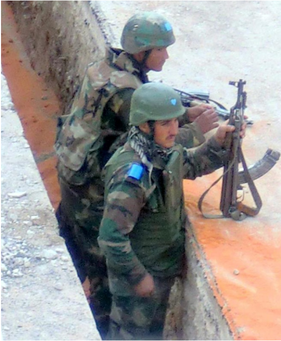
مدينة سقبا - جمعة الحظر الجوي

منذ الساعات الأولى بدأ الانتشار الأمني الكثيف و تطويق العديد من المساجد لهم و اجدت حشود عسكرية من عناصر الجيش عند جامع عمر بن الخطاب و وضعوا على أيديهم عصابات و شرائط لونها أزرق مع باص من الحجم الكبير بداخله عناصر من الجيش حيث أخرجوا أسلحتهم من النوافذ منتظرين أوامر الضابط المسؤول ، كما اتجه لجامع أبو بكر الصديق أكثر من ٥٠ عنصر مع ضابط يقوم بتوجيه انتشارهم و قاموا بالاختباء خلف السيارات و مداخل الأبنية بعد ذلك و رغم التواجد الأمني خرج أحرار معضمية الشام بمظاهرة بعد صلاة الجمعة بجانب جامع الصحابة الواقع على طريق داريا ، وكانت هتافاتهم تنادي بالحرية و تطالب بالحظر الجوي .