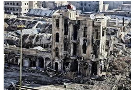
الثوار يجرون مشفى الكندي ويفرضون السيطرة

عملية مشفى الكندي تكشف مدى اهتراء النظام، فرغم وقوع المشفى على تلة عالية، ورغم دعم وإسناد قوات الطيران اليومي لقوات النظام، تمكن الثوار المجاهدون من اقتحام هذه الثكنة العسكرية وقتل وأسر كل من فيه، ومن جملة الأمور التي كشفتها عملية تحرير الكندي: - استعداد النظام لتدمير كل شيء في سورية، فالنظام لم يتوان في تحويل