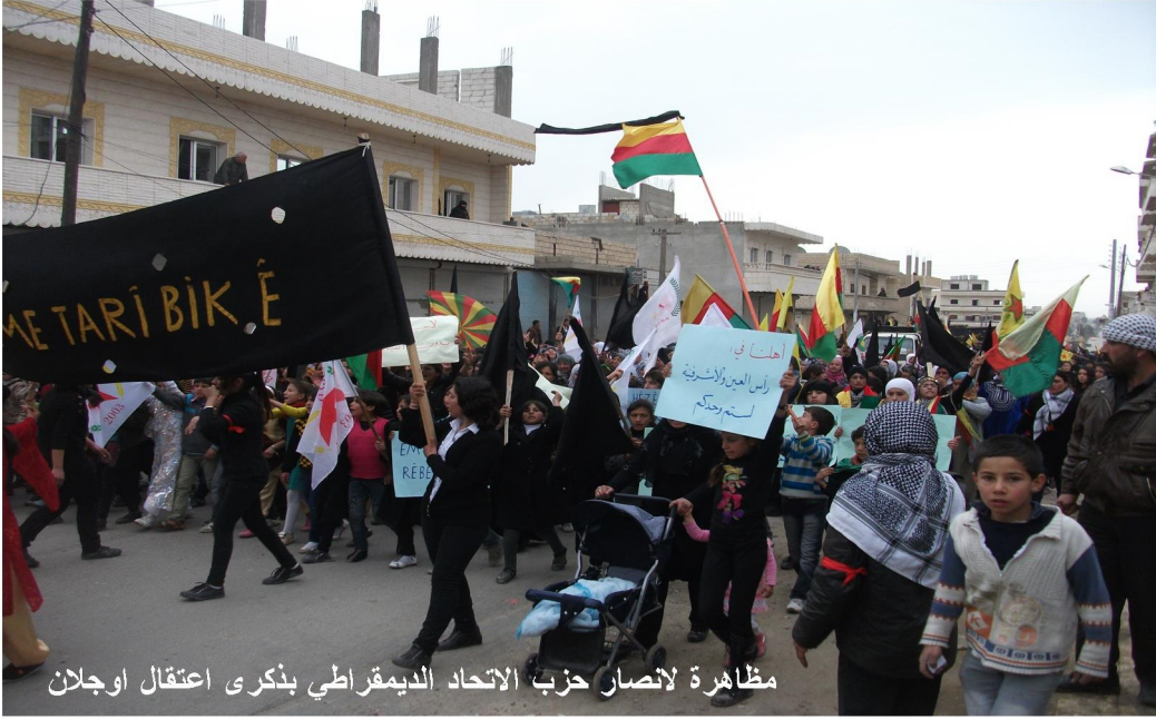
مظاهرة لانصار حزب الاتحاد الديمقراطي بذكرى اعتقال أوجلان