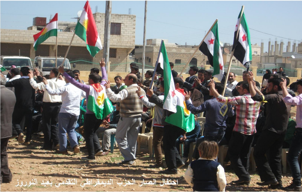
اعتقال انصار الحزب الديمقراطي التقدمي بعيد النوروز

جرت محاولات تفاهم بين المجلسين الوطني السوري والكردى تفتح الطريق لانضمام الثاني إلى الأول، لكنها باءت بالفشل، رغم أن المجلس السوري أصدر وثيقة معقولة بخصوص حقوق الأكراد، وتكررت العملية مع الائتلاف الوطني لقوى الثورة والمعارضة، لم يشارك حزب الاتحاد الديمقراطي في المفاوضات، ولم يقبل بالاتفاق الذي تم، وتكلمت بالنجاح بعد عدة جولات فاشلة، فانضم المجلس الوطني الكردى إلى الائتلاف.