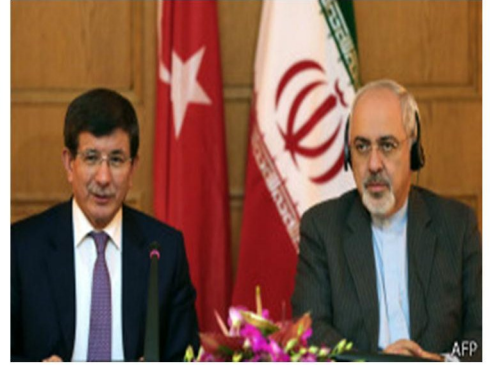
دعوة إيرانية تركية مشتركة لوقف إطلاق النار في سورية قبل انعقاد جنيف ٢.

كلنا بات يرى تحولاً في الموقف التركي تجاه أصدقائه النظام السوري، ونخشى أن يكون التقارب الحاصل بين تركيا من جهة وإيران وروسية من جهة على حساب الشعب السوري، وإذا أحسننا الظن بالأتراك فإن هذا التقارب دليل على تسوية تحققت وتضمن مصالح هذه الدول بعد زوال الأسد من جهة، وتحفظ ماله وجه الأسد. إن موقف الدول العربية ولا سيما الخليجية من انقلاب العسكر في مصر انعكس سلباً على الثورة السورية، فالعسكر المصري يؤيد الأسد بقمع الشعب، وبما أن تركيا وقفت ضد الانقلاب، وبما أن الفتور بات يعترى علاقاتها مع الدول الخليجية ولا