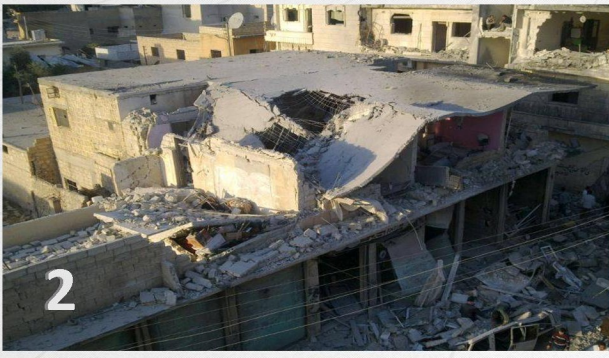
شهداء وأكثر من عشر جرحى في قصف للطيران الحربي على مدينة منبج