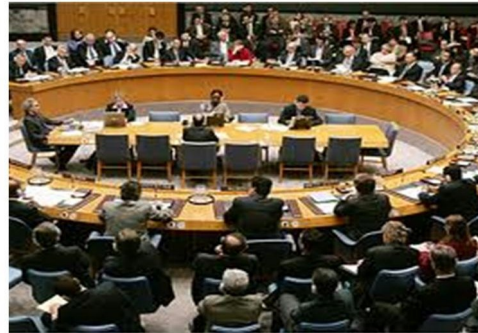
مجلس الأمن يميز رسمياً إجراء لجنة مشتركة بين

ثلاثة أعوام إلا أشهر ولم يتفق المجتمع الدولي على وقف شلال الدم في سورية، لم يتفق حتى على إدانة القتل الذي يحدث في سورية، ثلاثة أعوام ولم يتفق المجتمع الدولي على وقف دمار سورية، وبعد ساعات يتفق مجلس الأمن على تجريد سورية من سلاحها الكيماوي، ليس لأن الكيماوي قتل أكثر من ١٥٠٠ مواطن سوري،