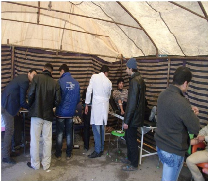
متطوعون يقومون بحملة تبرع بالدم