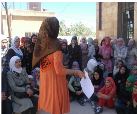
إحدى المتطوعات في هيئة فتيات الغد الحر