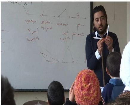
أحد المعلمين المتطوعين