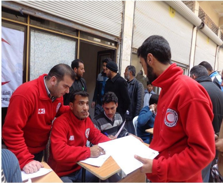
متطوعون في الهلال الأحمر