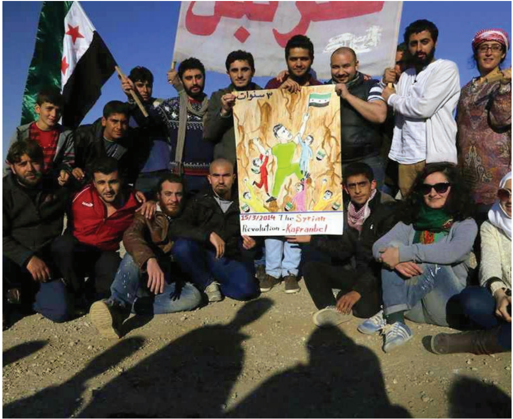
من مظاهرة جمعة «ثورة شعبية وليست حرب أهلية» - كفرنبل 14 آذار 2014