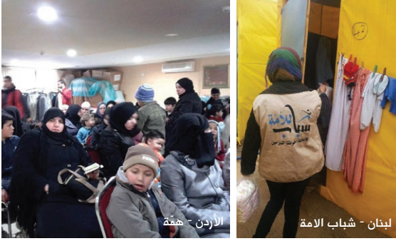
الاردن - همة