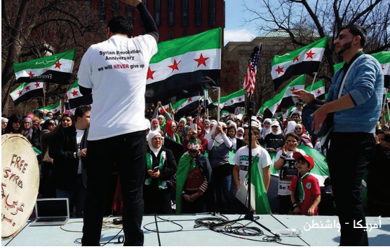
اسيكا - واشنطن