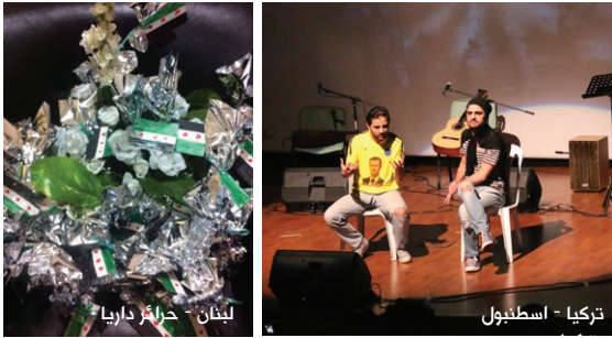
لبنان - حراير داريا