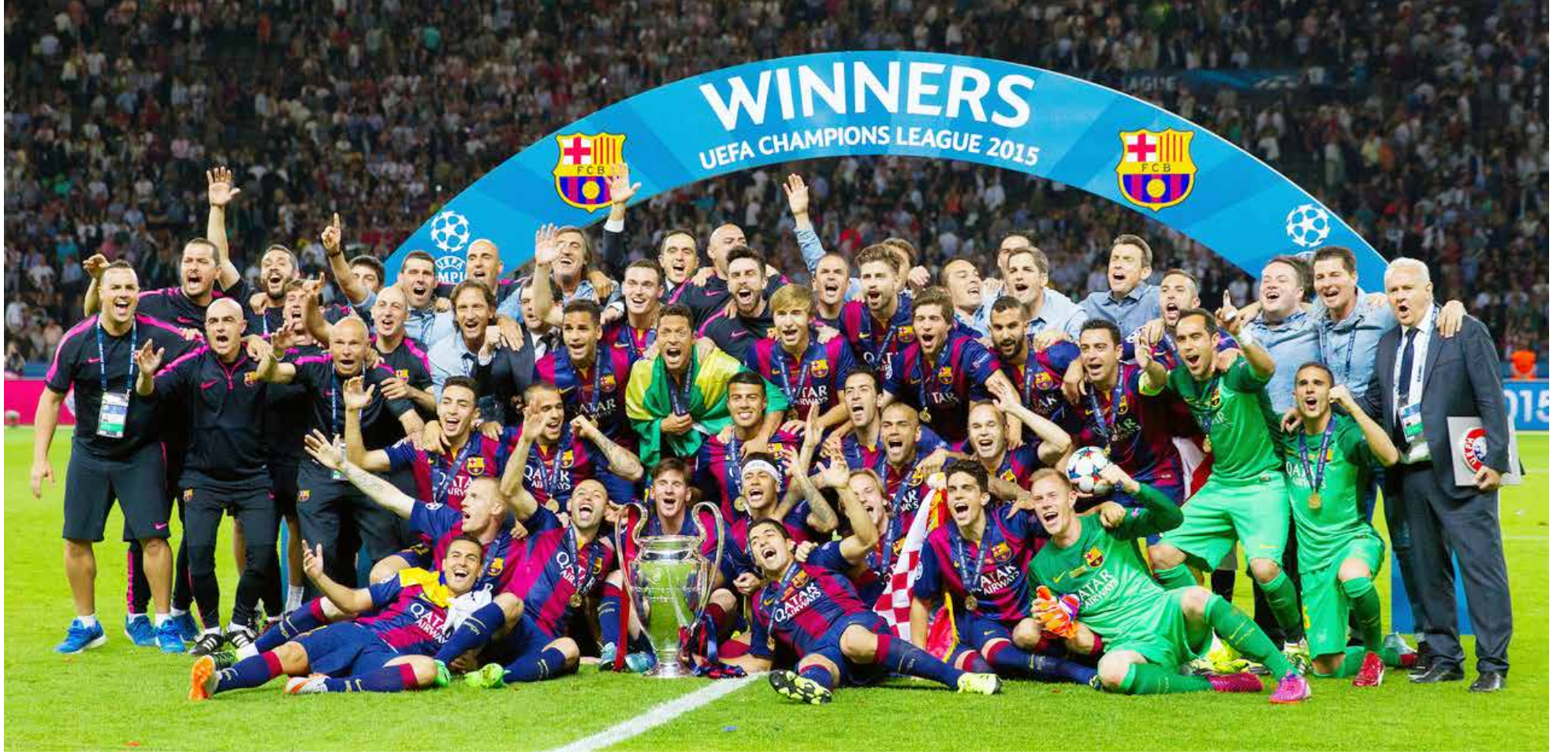
برشلونة يحرز الثلاثية التاريخية للمرة الثانية

صنع لاعبو برشلونة المعجزة وضمنوا إقامتهم الدائمة في الصفحة الذهبية من كتاب تاريخ كرة القدم، فباتوا أول فريق يحرز الثلاثية التاريخية للمرة الثانية، ليلة برلين الحاملة منحت اللقب الرابع في البطولة للاعبين مثل ميسي وانيسستا وتشافي، بينما كانت كابوسا مزعجا للاعبين السيدة العجوز، وبالتحديد حارسهم الذي لامست يده الكأس مرتين قبل أن يحرم من حملها، فاكتملت بالوصافة.