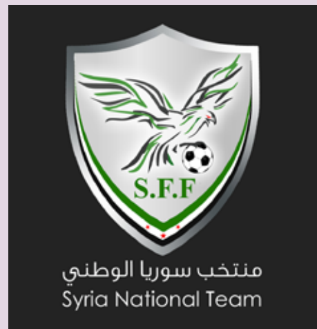
منتخب سوريا الوطني Syria National Team

وتم اختيار 120 لاعباً بارزاً من الذين كانوا يلعبون بالدوري السوري، حيث أقامت الهيئة المعسكر الأول في مدينة كلنس التركية، وضم حوالي 25 لاعباً. ويقول وليد: "التقينا مع مديرية الرياضة التركية، حيث رحبوا بفكرتنا ووضعوا اللاعبين تحت تصرفنا. وسنقيم المعسكر الثاني في مدينة مرسين، والثالث في مدينة أورفا وأقحولا، والرابع في اسطنبول. ومن خلال هذه المعسكرات سيتم اختيار ستين لاعباً كمنتخبين، أول ورديف". كما عُيّن "مروان منى" مدرباً للمنتخب، وهو الذي سبق له الفوز بذهبية كأس آسيا للشباب كلاعب في العام 1994. وكان لاعباً في صفوف المنتخب الوطني السابق، ومدرباً لنادي حطين في اللاذقية. واجهت الهيئة العديد من التحديات خلال تشكيل المنتخب، والتي تمثلت في بعد المسافات بين المحافظات التركية وقلّة الإمكانات المادية. يقول