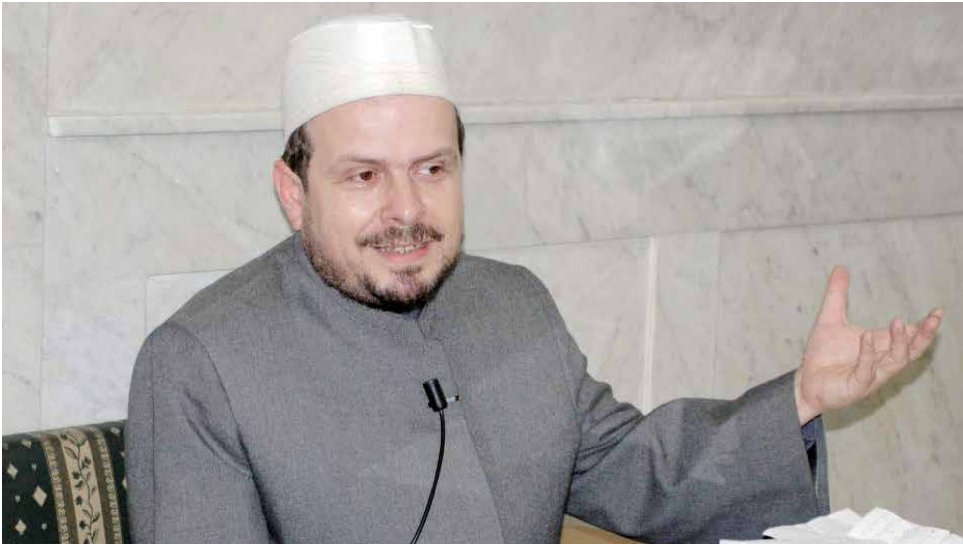
الدكتور محمد حبش

إلى هذه الحركات عندما جاءت لتساعدكم على اغتنام مقدرات الدولة، وعلى سبيل المثال داعش لديها موارد دولة وليس عليها مسؤوليات دولة، أي للتوضيح، داعش لا تنفق على المناطق التي تسيطر عليها، لا تبني شوارع، ولا تدفع رواتب، ولذلك هي في وضع اقتصادي قوي، لأنها لا تنفق إلا على محاربيها، حيث تجمع أموال النفط وتنفقه على السلاح فقط، وهذا يعني أنها قادرة على اجتذاب الكثير من أبنائنا. ولدى داعش أيضاً، مبررات فقهية ودينية، وللأسف هذه المبررات تدرس حتى الآن في المعاهد الشرعية، ونحن نعتبر هذا من أشد أنواع التناقض.. كوننا ندرسهم شيناً، وعندما يقومون بتطبيقه، تنهمم بالخيانة والإرهاب.