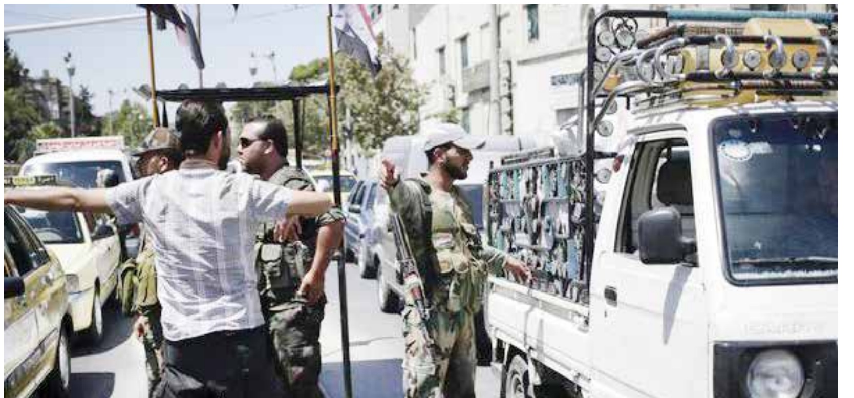
أكثر من ٢٥٠ حاجز تفتيش لقوات الأسد في مدينة حماة