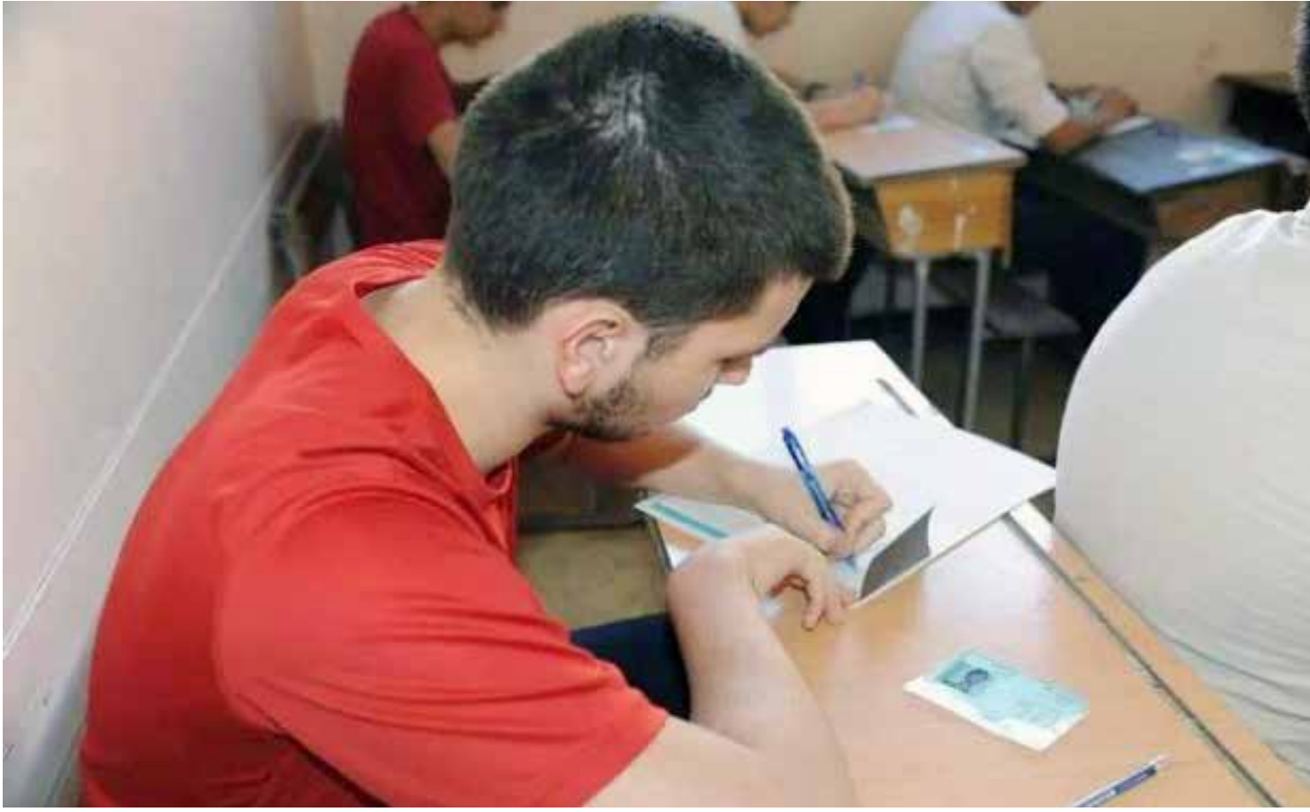
أكثر من ٢٣٠ ألف طالب وطالبة تقدم لامتحانات الشهادة الثانوية بمختلف فروعها العامة والشريعة والمهنية

انتهت منذ أيام امتحانات الشهادة الإعدادية وسط أجواء مشابهة تماماً للأجواء التي عاشها الطلاب في العامين المنصرمين من ناحية الفوضى وانعدام المراقبة والفساد، الذي يساهم فيه حتى المعلمون والمؤسسات الأمنية العاملة في معظم المناطق. مما أثار شكوك السوريين بأن امتحانات الشهادة الثانوية ستكون أكثر نزاهة مما كانت عليه في السنوات السابقة. وما أن بدأ الامتحان حتى قطع الشك باليقين مع تكرار صورة التسيب وحالات الغش التي اعتاد السوريون على رؤيتها بكثرة منذ بداية الحرب.