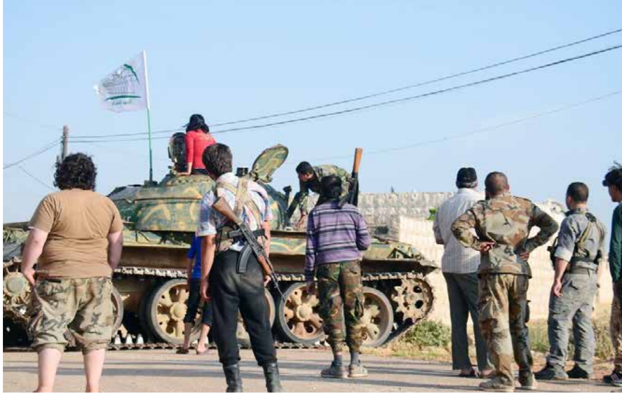
مقاتلون من المعارضة يستعدون لمعركة على أطراف «أم القرى» (خاص - صدي الشام)

فيما تابع «جيش الفتح» تقدمه بريف إدلب وصولاً لمشارف سهل الغاب والساحل السوري أهم معاقل النظام الشعبية في عموم سورية، وفي حين كانت فصائل حلب تمهد لفتح معركة تنهي تواجد النظام هناك، هاجم تنظيم «الدولة الإسلامية» ريف حلب الشمالي، دافعاً بذلك المعارضة لإعادة ترتيب أوراقها، بعد أن تلقت من «داعش» طعنة في الظهر