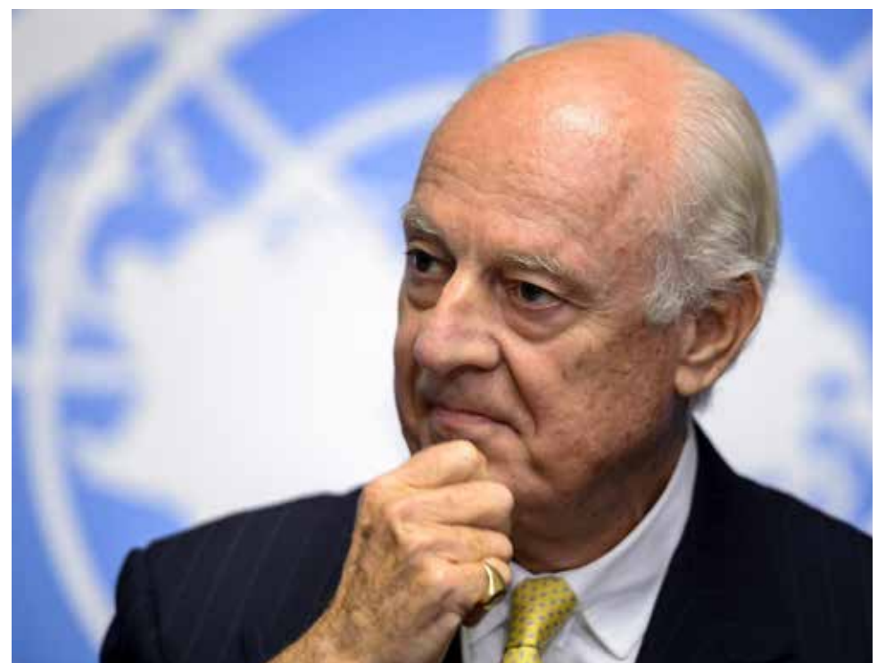
ستافان دي ميستورا - مبعوث الأمم المتحدة إلى سورية