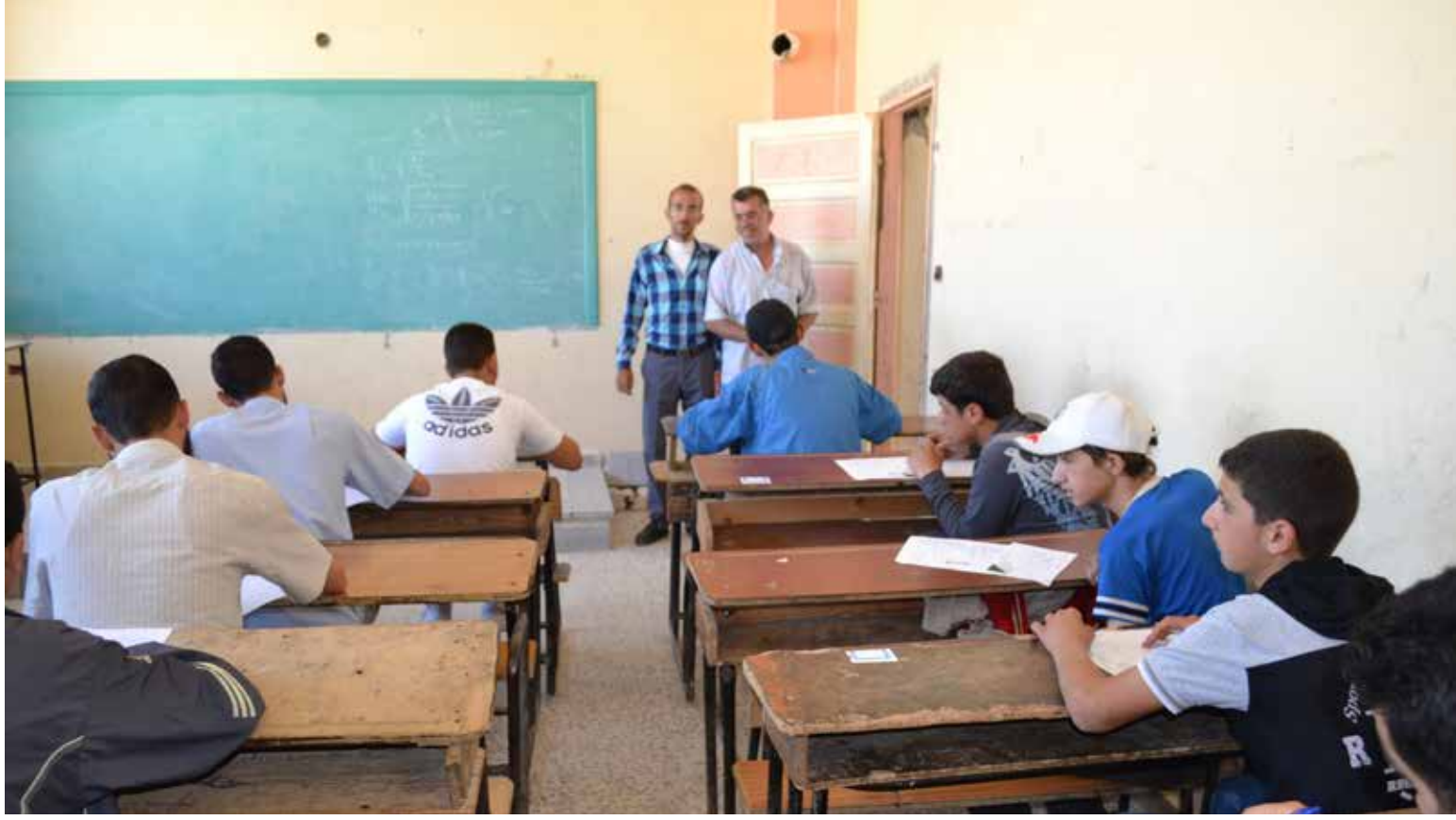
طلاب يقدمون امتحان في مدينة حمص

انتشار الغش والتسريبات الامتحانية لموالي النظام يفقدها مصداقيتها لدى الطلاب