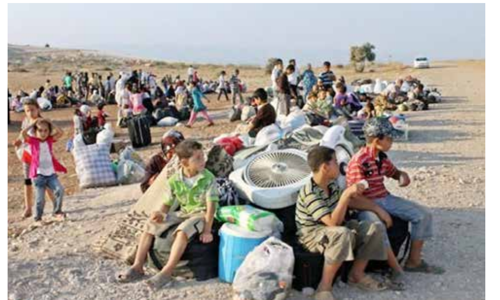
مئات السوريين تقطعت بهم السبل في صحراء الأردن

وأوضحت المنظمة في بيان أن «السلطات الأردنية حذت بشدة الدخول من سورية عبر المعابر الحدودية غير الرسمية شرق المملكة منذ أواخر مارس/آذار الماضي». ولقنت إلى أن «مئات السوريين تقطعت بهم السبل في منطقة صحراوية معزولة داخل الحدود الأردنية».