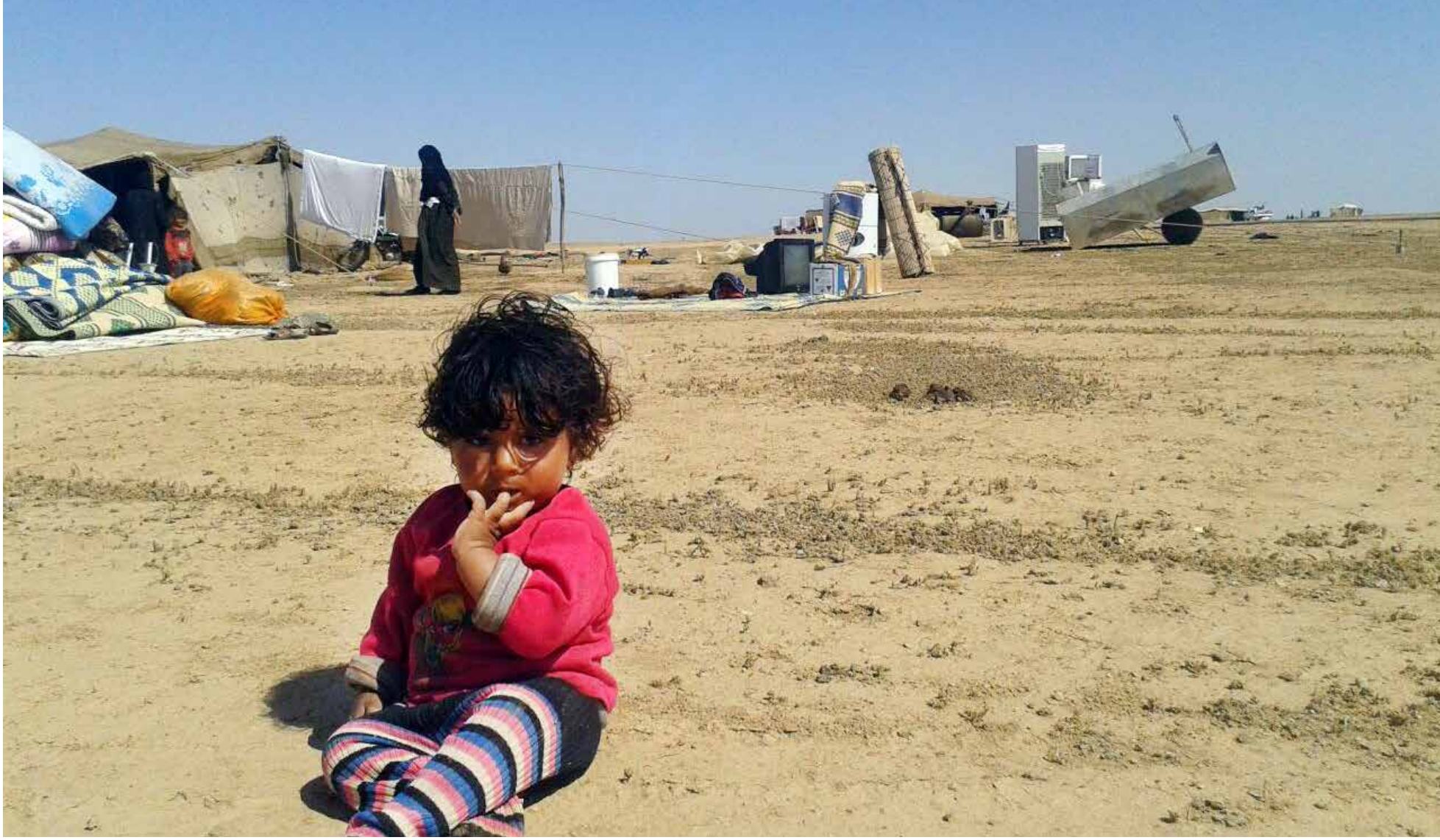
نازحون يفتشون العراء جنوبي جبل العزيز