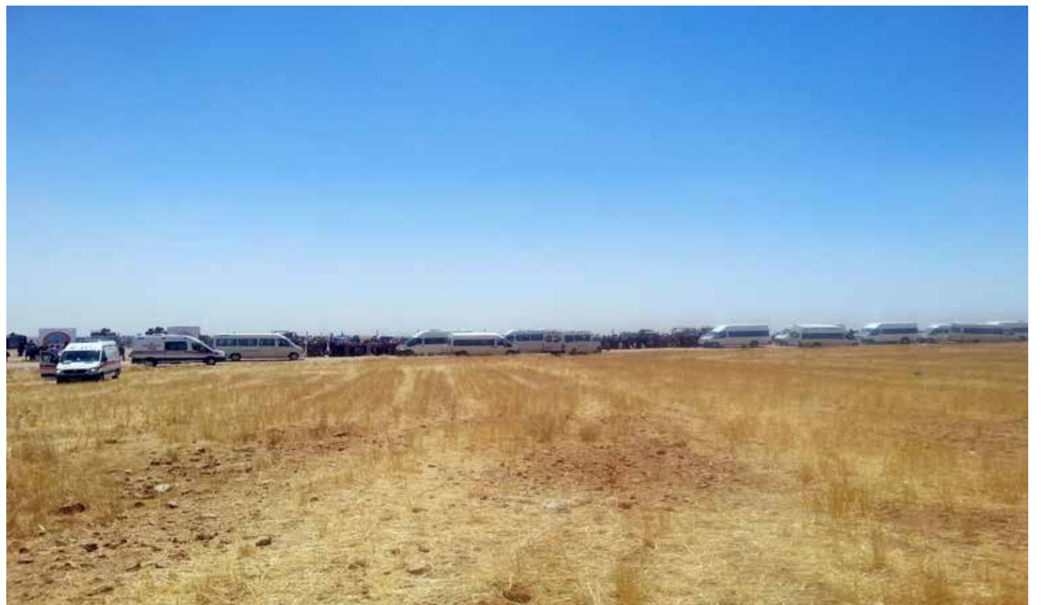
نازحون على الحدود السورية التركية قرب تل أبيض

وأضاف الحسكوي: «إن قرية فريسة، في الريف الغربي لمدينة رأس العين، تعرض للحرق. مع أنها