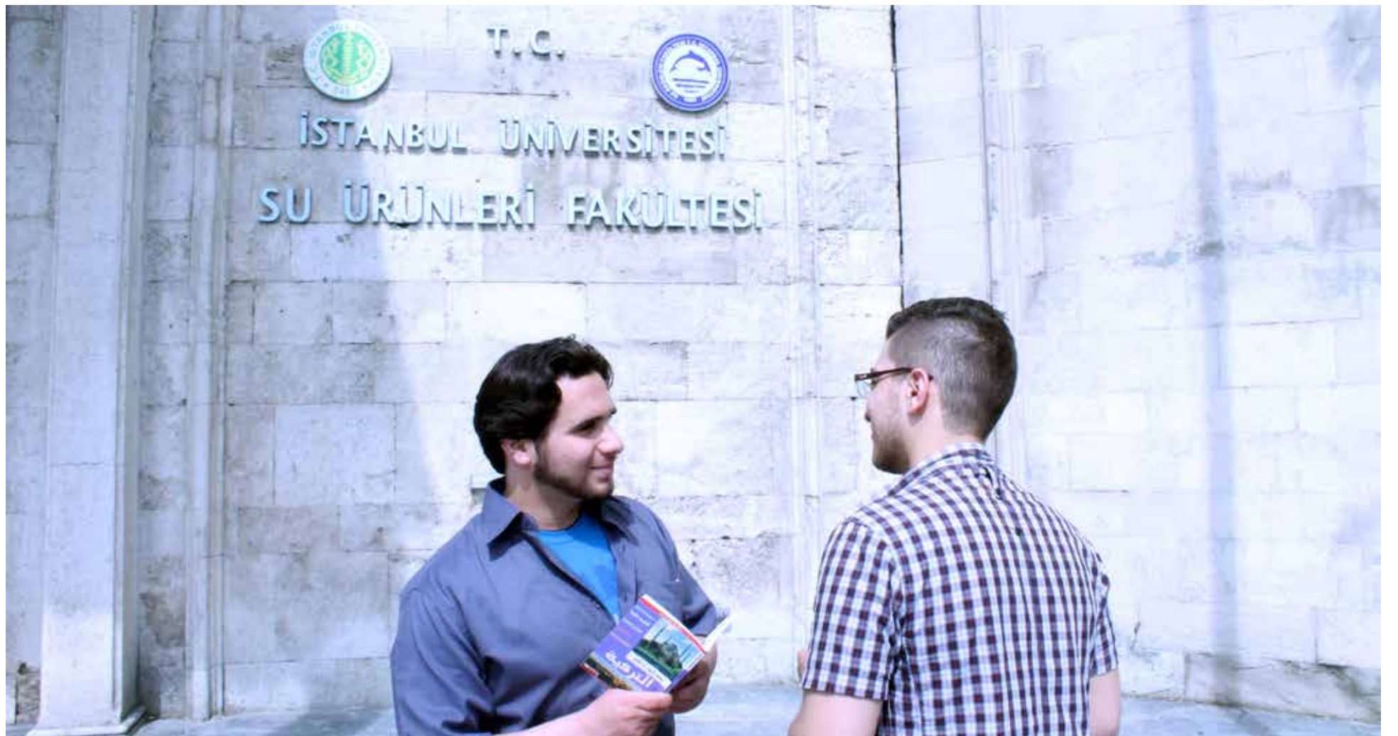
الامتحان المعياري التركي بوابة الطلاب السوريين والعراقيين للجامعات التركية (خاص - صدى الشام)

يذكر أن طلاب الشهادة الثانوية خضعوا خلال العام الجاري، لامتحان درجة الأعمال، والذي جرى على مرحلتين، حيث من المقرر أن تسهم نتيجة الاختبارين في تقييم الطلاب نهاية العام مع تقدير معدل نجاحهم.