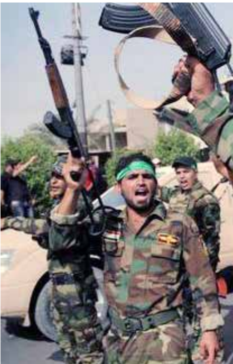
آلاف المقاتلين الشيعية وصلوا لمؤازرة قوات النظام بسورية

فمن جورين نقلت بعض المواقع الموالية للنظام وعوداً لقائد فيلق القدس الإيراني، قاسم سليماني، قال فيها «سيفانجا العالم بما نعد له نحن والقادة العسكريون السوريون حالياً». حيث تشكل القرية التي تقع في ريف حماة الغربي، بالنسبة لهذه المليشيات، بوابة سهل الغاب المؤيدة إلى الساحل، الذي من مهمتهم الدفاع عنه.