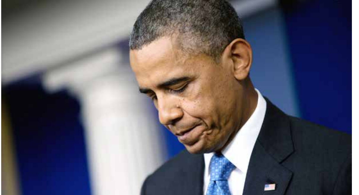
حل سياسي متوافر يضعف النظام وتقدم المعارضة (الانترنت)

إذا، «ثرثرة» أوباما بأن لا حل لسورية قريباً قد تكون إحدى التصريحات التي لا يتوقف عن إطلاقها والتي تبدو في بعض الأحيان متناقضة، كان يتكلم عن انتهاء شرعية النظام ثم يصرح بما قلناه في بداية المقال، وهكذا. الحل السياسي الآن تتوفر له شروط جديدة ممثلة في ضعف النظام الواضح، وفي تقدم المعارضة بسبب التنسيق الإقليمي الكبير.