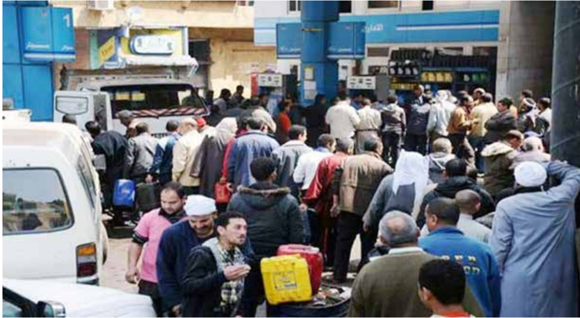
خسائر الاقتصاد السوري تقارب ٣٠٠ مليار دولار

بعد نحو ٥٠ يوماً على زيادة سعر البنزين، قررت حكومة النظام رفع سعر لتر البنزين إلى ١٥٠ ليرة، في وقت يتوقع أن تسير باقي المواد المحروقات على الطريق نفسه، بينما يشير اقتصاديون إلى ارتفاع سعر التضخم إلى ٣٠٪ عن عام ٢٠١٠.