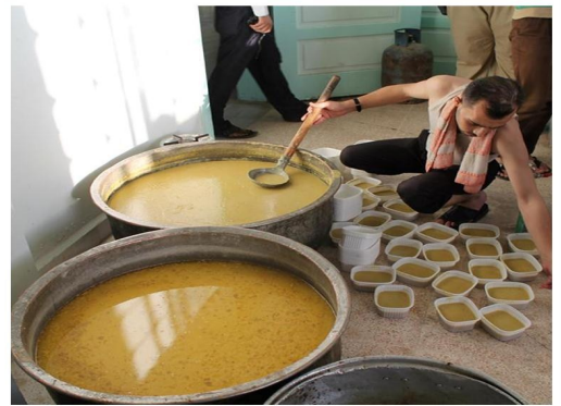
من موائد إفطار حملة إحسان

هو شهر رمضان الثاني الذي يمر على مدينة منبج المحررة ، لكن شتان ما بين رمضان السنة الماضية ورمضان اليوم .. رمضان الماضي الذي شهد الساعات الأولى منه تحرير مدينة منبج ، بعد أن حررها الثوار قبل يوم واحد من بداية شهر رمضان المبارك .. لكن الظروف الاقتصادية والاجتماعية تبدو مختلفة تماماً