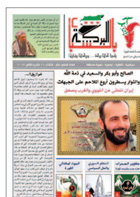
البركة بالشباب - العدد 17 - 2013/11/26