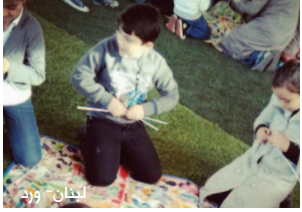
لبنان - ورد