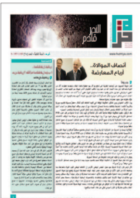
حربة - العدد 64 - 2013/11/25