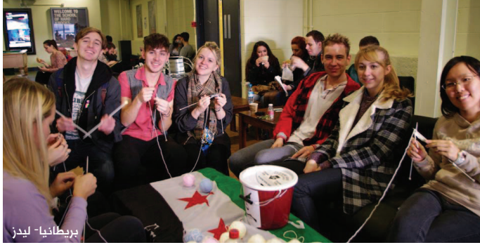
بريطانيا - ليدز