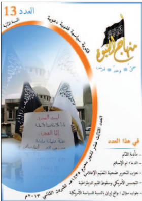
مفتاح الفتنة - العدد 13 تشرين الثاني 2013