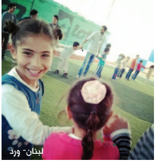
لبنان - ورد

وقامت الجالية السورية في بريطانيا بحملة ضد دعوة الأم أغنيس مريم، الموالية لنظام الأسد، للمشاركة في المؤتمر الدولي لمكافحة الحرب الذي ينظمه «تحالف أوقفوا الحرب»، وقد نجحت الجالية بالضغط على المنظمين وسحب اسم الأم أغنيس من قائمة المشاركين بالمؤتمر، كما قامت الجالية أيضًا بتنظيم مظاهرة يوم السبت الموافق 30 تشرين الثاني في لندن أمام مقر انعقاد المؤتمر في «مركز أمانبول» بشارع مارشام، لدعوة المشاركين لاتخاذ موقف ضد الحرب التي يشنها الأسد على شعبه.