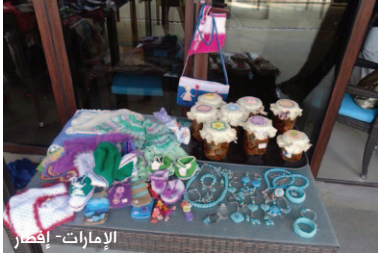
الإمارات - إيفر