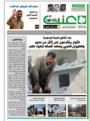
عنب بلدي - العدد 92 - 2013/11/24