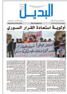
البديل - العدد 115 - 2013/11/24