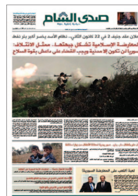
صدي الشام - العدد 16 - 2013/11/26