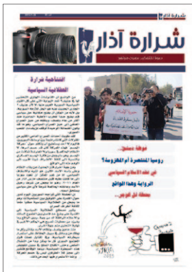
شراة آذار - العدد 93 - 2013/11/24