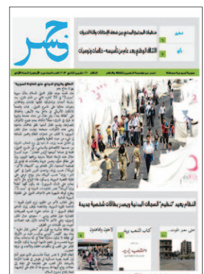
جسر - العدد 46 - 2013/11/26