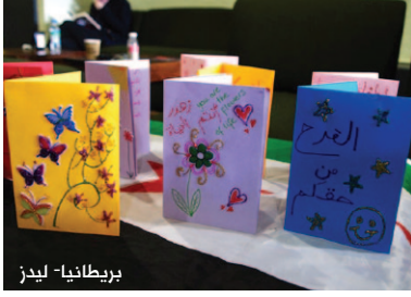
بريطانيا - ليدز