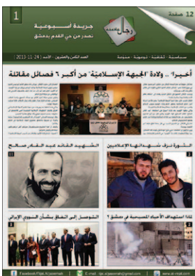
رجال القصباء - العدد 28 - 2013/11/24