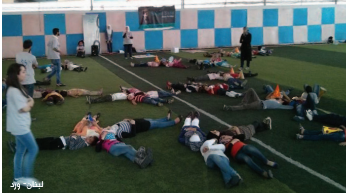
لبنان - ورد

حوالي 200 أضحية وتوزيعها على الفقراء في عيد الأضحى، كما وزعت سلا غذائية على النازحين في تل أبيب، وفي مختلف المناطق المحررة، إضافة لتوزيع ملابس وأحذية على النازحين والفقراء، كما قدمت الحليب للأطفال المحتاجين، وتستمر الجمعية إلى الآن بتوزيع سلا غذائية على الفقراء شهريًا.