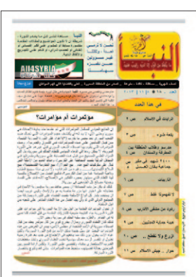
النيا - العدد 18 - 2013/11/8