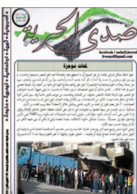
صدي الحرية - العدد 37 - 2013/11/22