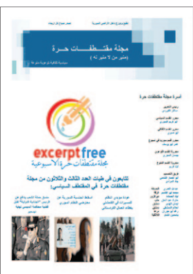
مقطعات حرة - العدد 33 - 2013/11/27