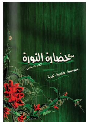
حضارة الثورة - العدد 6 - 2013/11/27