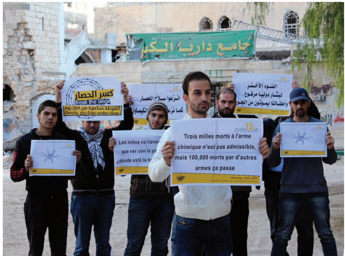
إطلاق حملة «كسر الحصار» عن مدينة داريا - داريا 29 تشرين الثاني 2013

الحل السياسي بات ضرورة لوضع الحرب جانباً والالتفات إلى ما خلفته من آثار خطيرة على الواقع السوري. آثار لم تقتصر على الوضع الإنساني والاقتصادي، بل تعدته إلى الواقع الاجتماعي والسياسي والذي تمثل بنمو كيانات غريبة عن طبيعة المجتمع السوري، باتت تشكل خطراً على مستقبله.