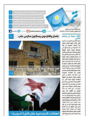
تمدن - العدد 11 - 2013/11/23