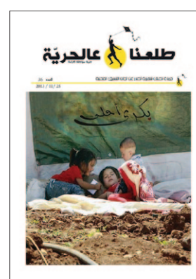
طلعنا جاررية - العدد 36 - 2013/11/25