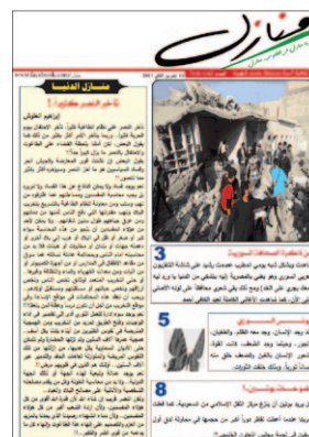
مفازل - عدد مزوج 12+11 - 2013/11/15