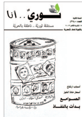
ثوري أنا - العدد 37 - 2013/11/15