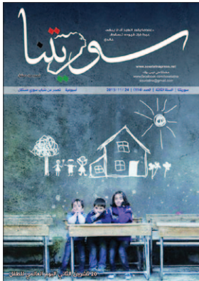
سورينا - العدد 104 - 2013/11/24