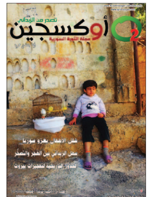
أوكسجين - العدد 85 - 2013/11/22