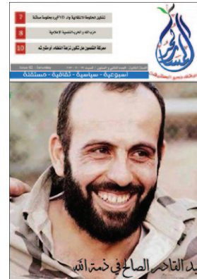
المسار الحر - العدد 62 - 2013/11/23