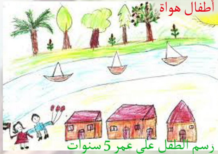
رسم الطفل علي عمر 5 سنوات