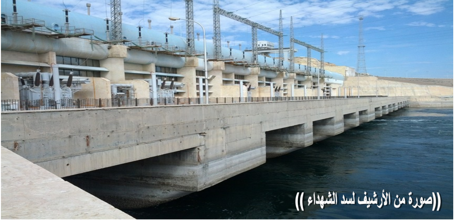
((صورة من الأرشيف لسد الشهداء))

سد الشهداء ((تشرين سابقاً)) يخرج عن العمل مما يهدد بكارثة إنسانية في ريف حلب الشرقي ..