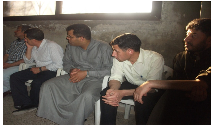
صورة من انتخاب المكتب الطبي