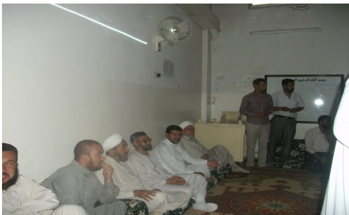
صورة من انتخاب المكتب الشرعي

تلاها في اليوم التالي اجتماع مطول مع ممثلي المكاتب الإعلامية والصحف المحلية والإعلاميين المستقلين لوضع رؤية موحدة حول شكل وهيكلية المكتب الإعلامي للمجلس الثوري ونتج عن الاجتماع