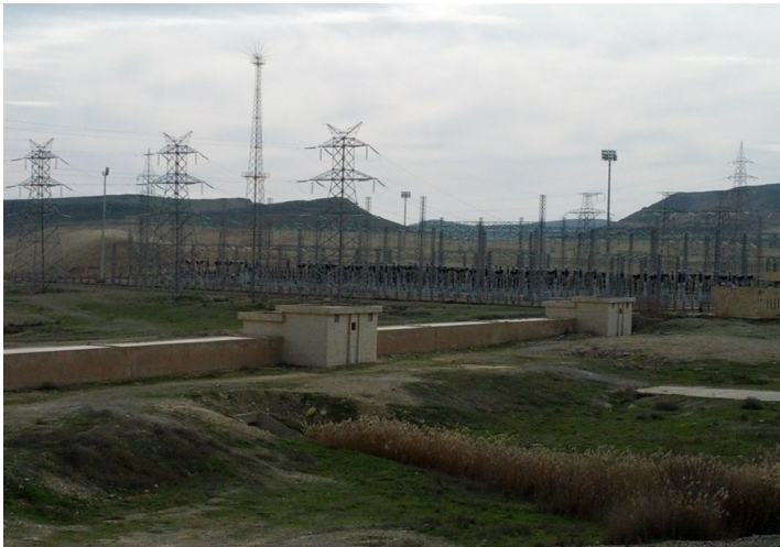
(( صورة لمحطة كهرياء سد الشهداء الخارجة عن الخدمة ))

بالإضافة إلى أهوال الحرب والدمار التي يعيشها الشعب السوري جرّاء همجية القوات الأسدية ، وحالات النزوح والحصار الذي يتعرض له الأهالي في المدن المحررة جعلهم يعيشون كوارث إنسانية ، فغالبية المدن المحررة حرمت من خدمات المياه والكهرباء ، لكن نستغرب أن تأتي المصائب هذه المرة من دولة مجاورة -تركيا - إحدى الدول المؤسسة لما يسمى أصدقاء سورية ، الحكومة التركية والتي أسهبت خلال الفترات الماضية عقب تحرير مدن الريف الشرقي لحلب باستجرار كميات مياه أكثر من النسبة المتفق عليها بحسب القوانين الدولية ، تركيا التي تدعي وقوفها مع الشعب السوري تساهم اليوم في الحصار المفروض على الشعب السوري بقطعها مياه نهر الفرات كلياً عن سورية ، وأشار شهود عيان حتى أن مدخل نهر الفرات إلى الأراضي السورية بالقرب من مدينة جرابلس التركية بات ممرراً للمشاة "كناية عن الحالة التي وصل إليها حال النهر" ، بعد أن كنا نسمع بين يوم وآخر عن غرق شبان كانوا يسبحون في مياه النهر الأكبر والأكثر غزارة في سورية ، ثلاثة أيام وريف حلب الشرقي بشكل عام ومنبج خصوصاً كبرى مدن سورية بعد المحافظات ، تعيش تحت الظلام بسبب خروج سد الشهداء ((تشرين سابقاً)) عن العمل كلياً نتيجة قطع مياه نهر الفرات، مما أدى لقطع المياه بشكل تلقائي عن المدينة ، فسد الشهداء يعتبر المزود الأول والأخير للكهرباء لمدينة الريف الشرقي في حلب بعد أن قطع النظام الأسد الكهرياء عن كافة المدن المحررة في الريف الشرقي .