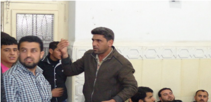
انسحاب الحراك الثوري

" عبد اللطيف " : المكتب الطبي والقانوني والشرعي سيتم إجراء انتخابات لتعيين رؤساء هذه المكاتب ، أما بقية المكاتب سيتم تعيينهم وفق الكفاءة .