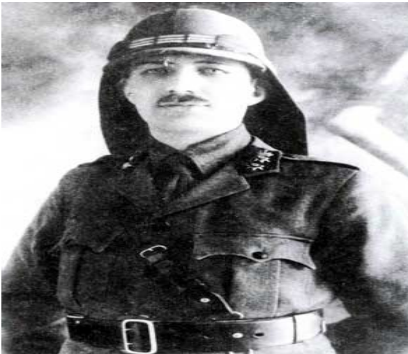
الشهيد يوسف العظمة

ومن ثم تم توقيع معاهدة الاستقلال مع فرنسا لتوحيد كافة الأقاليم السورية بما فيها دولة العلويين في عام ١٩٣٦ ، لكن فرنسا رفضت ضم دولة لبنان إلى الجمهورية السورية ، بسبب رفض المواردية الانضمام لها ، ويذكر المؤرخ " سامي مبيض " أن المواردية شاركوا مع الفرنسيين في معركة ميسلون ضد القوات السورية ، ونشبت خلافات عارمة بين المسلمين والموارنة في لبنان احتجاجاً على رفض انضمامهم إلى الدولة الأم