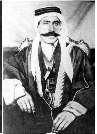
سلطان باشا الأطرش

ليعلن فيما بعد عن دستور جديد للجمهورية السورية ، عام ١٩٣٠ ، واتخذ لها علماً جديداً عبارة عن ثلاثة أشرطة عرضية الأخضر في أعلاه ويتوسطه اللون الأبيض وثلاثة نجوم حمراء وفي الأسفل اللون الأسود .