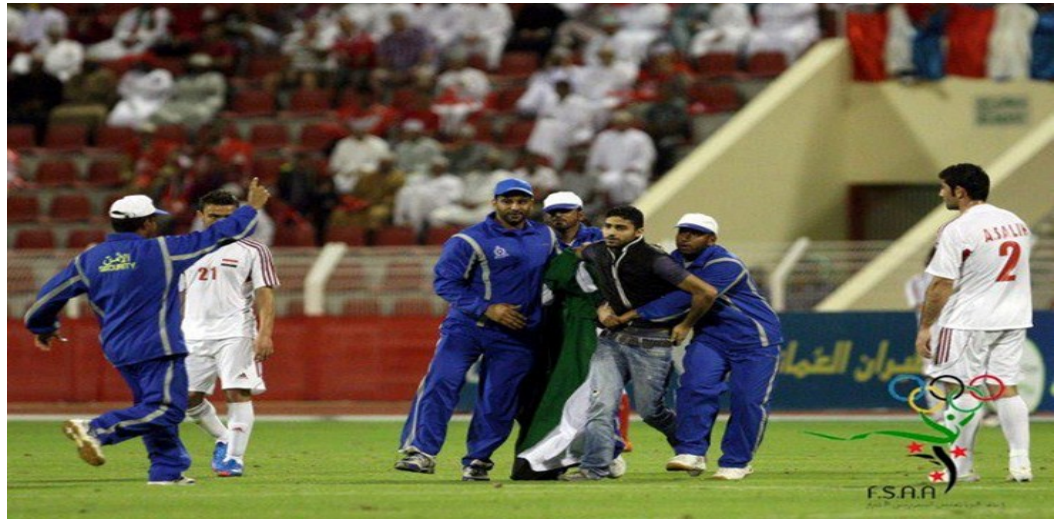
(الصورة للمشجع السوري من مباراة سابقة ((

قوات حفظ النظام الكويتية وتخرج المشجع السوري بالعنف وسط صيحات من الجماهير السورية هاتفة للثورة السورية ، وكان ذات الشاب الذي اقتحم المباراة قد اقتحم مباراة سابقة للمنتخب السوري مع نظيره الكويتي ضمن مباريات بطولة غرب آسيا التي أقيمت في الكويت حاملاً معه علم الثورة ..