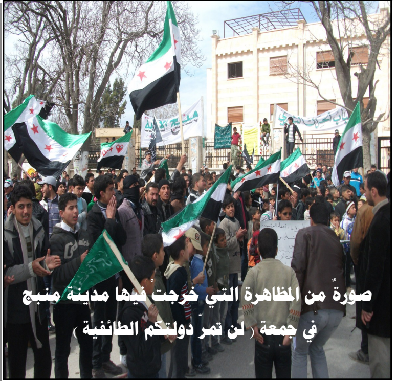
صورة من المظاهرة التي خرجت فيها مدينة منبج في جمعة ( لن تمر دولكم الطائفية )

كتيبة الفاروق تؤمن انشقاق أربعة عناصر من معبر اليعربية المحاذي للأراضي العراقية وإيصالهم إلى ذوبهم في ريف دمشق وحلب وادلب . هذا وقد تبرعت الكتيبة مع الكتائب التي حررت المعبر بكل الذخيرة والغنائم التي حصلت عليها من المعبر للكتائب الموجودة في حمص لفك الحصار عنها وهي ( خمسة مليون ليرة ومدفعي عيار ٢٣ ورشاشين عيار ١٤.٥ و دوشكا )