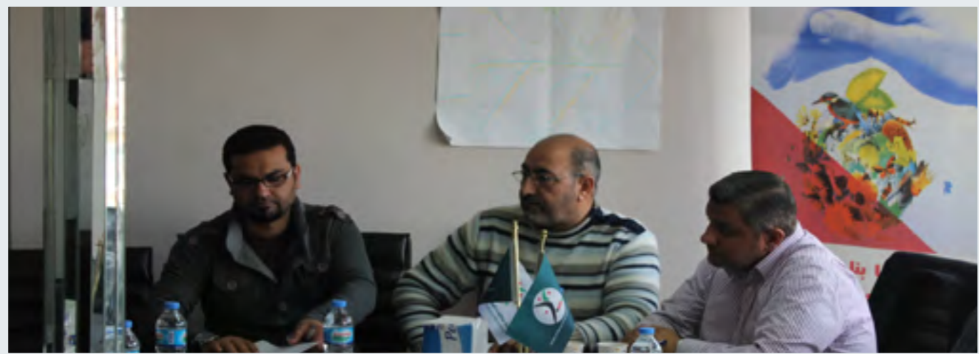
اتحاد منظمات المهتمين الهندي السوري

للطلبة السوريين فور إدخال أسمائهم في النظام الإلكتروني. كما أعجب بفكرة أن تقوم الجمعيات التي توزع سلال غذائية