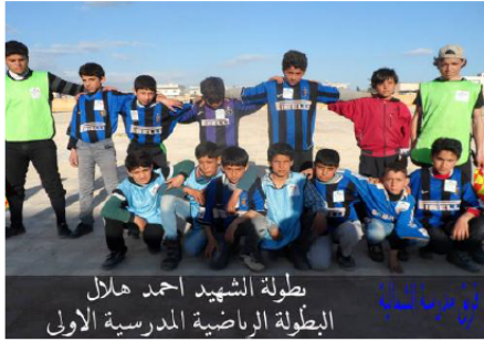
بطولة الشهيد أحمد هلال البطولة الرياضية المدرسية الأولى

مسرح الطفل - كورال الإنشاد - معرض الرسم - البطولات الرياضية. بدأ المشروع بعرض مسرحي مع فرقة