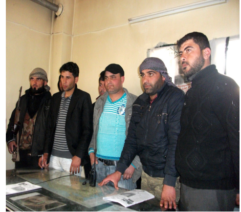
( عناصر من كتيبة أبو حبيب )