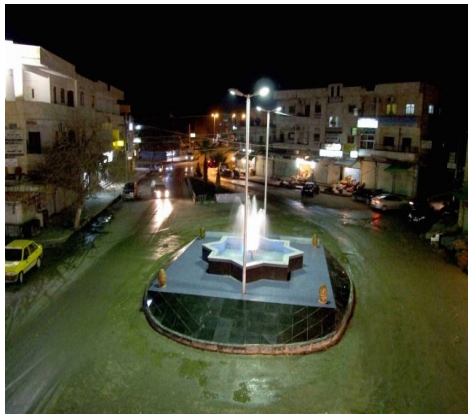
( منبج - ساحة الأمويين )

لا يخفى عن أي أحد من أبناء منبج أنها اختيرت في الشهور الأولى من تحريرها "المدينة المثالية" ضمن المناطق السورية المحررة ، وكلمة حق تقال أننا نعيش ظروفًا جيدة جداً مقارنة بغيرنا من المدن الأخرى المحررة أو حتى الكثير من المدن الغير محررة، لن أقول أننا في الفترة القليلة الماضية فشلنا في الحفاظ على هذا اللقب على أرض الواقع، بل إنني سأسلم بالقدر وأقول أن هناك من استحق أن يأخذ منا هذا اللقب، إن لم يكن بسبب تراجع أداء القائمون على تسيير أمور المدينة، فسيكون لأن إخوان لنا في مدينة سوريا محررة ومحاصرة وتعرضت للكثير من المجازر والجرائم التي أبكت قلوبنا قبل عيوننا جعلوا من مدينتهم مثالية بكل ما تحمله هذه الكلمة من معنى. مدينة أخوة العنب والدم (داريا) ، لأن أبنائها والقائمين على تسيير أمورها أثبتوا أن الثورة لن يجني ثمارها إلا بعد أن تروى شجرتها بعرق ثوارها ودم شهدائها . عرفت ذلك من صديق جاء ليستفسر ويقتبس منا كيف ولماذا وصفت منبج بالمدينة المحررة المثالية، إلا أن فضولي جعلني أسأله عن أوضاع داريا الإدارية بعد أن أجبر أبنائها النظام على الانسحاب منها وفشله بإعادة السيطرة عليها فبدأ قائلا: انتخبنا مجلسا ثوريا مدنيا وآخر عسكريا يعمل تحت إمرته ، بحيث أن الأخير لا يقوم بأي عملية إلا بالتنسيق وبموافقة المجلس الثوري، ولدينا محكمة شرعية تنظر بكل الشكاوي ويحق لها مراقبة كل الدوائر والمؤسسات الحيوية في المدينة وحتى الأسواق والمحال التجارية ، وفي حال ثبوت أي مخالفة أو حدوث أي مشكلة تقوم