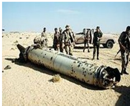
(الصورة لصاروخ سكود عراقي استخدم في الحرب العراقية الأولى)

طور العراق إبان حكم صدام حسين صاروخ سكود بحيث قللت حمولته من أجل منحه مدى أبعد (سكود - ب، وسكود طويل المدى ذي حمولة أقل، صاروخ الحسين، وصاروخ العباس الذي يعد أقلهم حمولة وأطولهم مدى) وتتميز جميع صواريخ سكود العراقية -ماعدا العباس- بإمكان إطلاقها من منصات متحركة. وتم تطويرها أيضاً لكي تستطيع ان تحمل رؤوس حربية وكيميائية أيضاً .