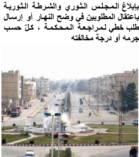
( منبج - دوار السبع بحرات )

ببلاغ المجلس الثوري والشرطة الثورية باعتقال المطلوبين في وضح النهار أو إرسال طلب خطي لمراجعة المحكمة ، كل حسب جرمه أو درجة مخالفته مسلم على جبهات القتال ، ولا حتى في الطريق، ومن المحاكم حدث ولا حرج ، وهيئات ومجالس بالجملة ، وكتائب تخطى عددها حاجز الستين . و عجز الثوريون والعسكريون وكل أبناء المدينة عن حفظ أسمائها لكثرتها . ورغم كل ذلك فالخطف لا دين له ، ولا يوجد أحد بمنأى عنه ، و من كان بالأمس شبيحاً ومؤيداً لنظام الإجرام الأسدي وهو الآن يتسلى على الثورة والجيش الحر ويصبح ثائراً أباً عن جد ، والماء لا نراها إلا مرة في الأسبوع رغم أن نهر الفرات يمر بقربنا ولدينا بحيرة خلف سد أسميناه سد الشهداء ، حرره الشرفاء من أبناء مدينتنا لكنه لم يشفع لنا أو يخفف عنا ظلام الليل لأن التيار الكهربائي أمسى ضيفاً خفيف الظل لا يطيل بزيارته لبيوتنا ، هنا قاطعني الضيف وقال : صار بدها سيكارة ، وضحك قليلاً ظناً منه أنني أمازحه أو أنني أردت إخفاء حقيقة مدينة جاء ليتعلم منها كيف يجعل من مدينته مثالية .