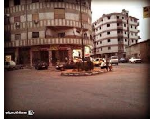
( مدينة داريا )

لا يخفى عن أي أحد من أبناء منبج أنها اختيرت في الشهور الأولى من تحريرها "المدينة المثالية" ضمن المناطق السورية المحررة ، وكلمة حق تقال أننا نعيش ظروفًا جيدة جداً مقارنة بغيرنا من المدن الأخرى المحررة أو حتى الكثير من المدن الغير محررة، لن أقول أننا في الفترة القليلة الماضية فشلنا في الحفاظ على هذا اللقب على أرض الواقع، بل إنني سأسلم بالقدر وأقول أن هناك من استحق أن يأخذ منا هذا اللقب، إن لم يكن بسبب تراجع أداء القائمون على تسيير أمور المدينة، فسيكون لأن إخوان لنا في مدينة سوريا محررة ومحاصرة وتعرضت للكثير من المجازر والجرائم التي أبكت قلوبنا قبل عيوننا جعلوا من مدينتهم مثالية بكل ما تحمله هذه الكلمة من معنى. مدينة أخوة العنب والدم (داريا) ، لأن أبنائها والقائمين على تسيير أمورها أثبتوا أن الثورة لن يجني ثمارها إلا بعد أن تروى شجرتها بعرق ثوارها ودم شهدائها . عرفت ذلك من صديق جاء ليستفسر ويقتبس منا كيف ولماذا وصفت منبج بالمدينة المحررة المثالية، إلا أن فضولي جعلني أسأله عن أوضاع داريا الإدارية بعد أن أجبر أبنائها النظام على الانسحاب منها وفشله بإعادة السيطرة عليها فبدأ قائلا: انتخبنا مجلسا ثوريا مدنيا وآخر عسكريا يعمل تحت إمرته ، بحيث أن الأخير لا يقوم بأي عملية إلا بالتنسيق وبموافقة المجلس الثوري، ولدينا محكمة شرعية تنظر بكل الشكاوي ويحق لها مراقبة كل الدوائر والمؤسسات الحيوية في المدينة وحتى الأسواق والمحال التجارية ، وفي حال ثبوت أي مخالفة أو حدوث أي مشكلة تقوم