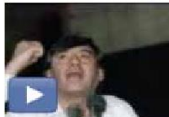
مددوح عدوان أثناء مؤتمر اتحاد الكتاب العرب عام 1979 http://youtu.be/Zb1dbHuSgv8

أنا أخجل من اعلام يكذب حتى في درجة الحرارة الكذب نوعان: قول ما يغاير الحقيقة و نوع اخفاء قسم من الحقيقة او كاملها الكذب ينبع من الخوف.