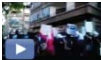
مظاهرة في دمشق شارع بغداد 5/7/2011 منطقة السمانة http://youtu.be/pdvUAX9qhww

5/7/2011دمشق، شارع بغداد منطقة السمانة. نادت بإسقاط النظام ورحيل حزب البعث وآل الأسد... كما هتفت لحماة والشهيد... لم يتم أي اعتقال وبدت في تمام الساعة السابعة