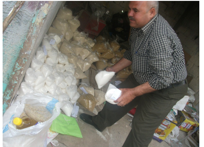
عمليات توزيع الحصص الغذائية في جمعية الإنسانية