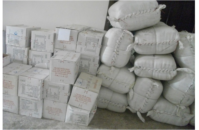
المواد الغذائية التي يقوم المكتب الإغاثي للمجلس الثوري بتوزيعها في منبج