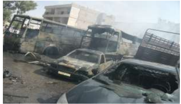
آثار الدمار جانب البناء الذي تم قصفه