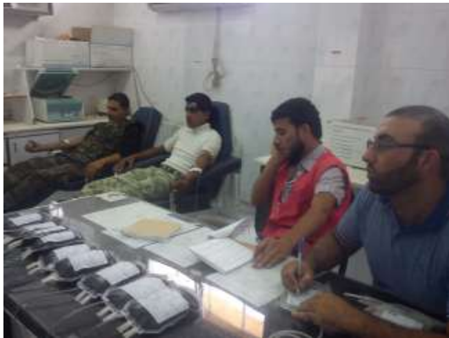
((عمليات التبرع بالدم أثناء القصف))