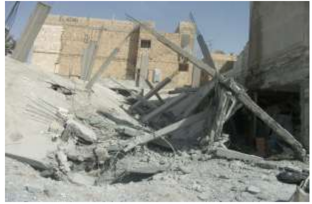
طال القصف البناء الموجود في الزاوية وهو قيد الإنشاء

أعلن الجيش الوطني السوري عن تشكيل لواء فرسان الفرات التابع لفرقة صقور البادية الذي يضم في صفوفه غالبية كتائب منبج و جرابلس ومسكنة و الخفسة وريف الرقة بحضور ورعاية إعلامية حصرية من جريدة المسار الحر بعد عدة اجتماعات في تركيا وسورية ، سيكون هذا التشكيل نواة للجيش الوطني السوري الذي سيحل مكان الجيش الحر ، وجاء تشكيل هذا اللواء على غرار تشكيل قيادة الجيش الوطني وهيكلته التي تعتمد على تشكيل جيش نظامي يضم عدة قيادات متسلسلة تصل إلى قيادة واحدة ، ومن المتوقع خلال الأيام القادمة أن تعلن القيادة العامة للجيش الوطني بقيادة اللواء محمد الحاج علي عن لواء فرسان الفرات بتسجيل مصور .