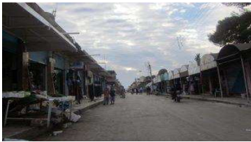
الدرباسية - شارع السوق