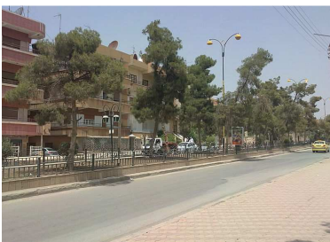
قامشلو - شارع البريد