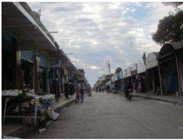
الدرايسية - شارع السوق