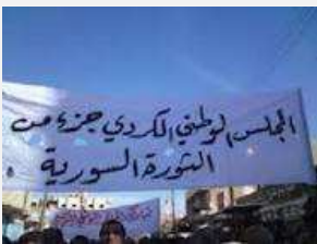
صور من اجتماع المجلس الوطني الكوردي