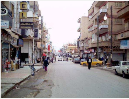
قامشلو - شارع الوحدة

في حادثة تبدو غريبة عن مجتمعنا و طابعنا الثقافي المتعارف عليه في مدينة الدرباسية وما حولها هاجمت مجموعة مسلحة مكونة من اربعة عناصر احد البيوت في المدينة و على الطريقة عصابات المافيا و عصابات القتل الممنهج كما هي الحال في العراق و روسيا و غيرها و من ثم