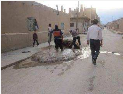
الدرباسية - خاص