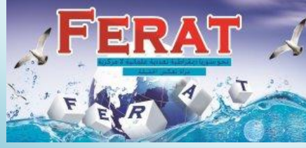
مرآة تعكس الحقيقة