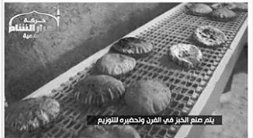
يتم صنع الخبز في الفرن وتحضيره للتوزيع

(٢١) هل هناك صواريخ مضادة للطيران تحت أيديكم ولا تستخدمونها؟ الصواريخ المضادة للطيران غير موجودة لدينا، ومن كانت هذه الصواريخ بمتناول يده فليأتنا بها و نحن نشترتها إن شاء الله، و نحن نقوم بواجبنا لرد الطائرات بما نستطيع بالمضادات الأرضية ٢٣ و ١٤،٥ يقول الله (( لا يكلف الله نفساً إلا وسعها))، ومن كان لديه زائد عما لدينا فليقم بواجبه.