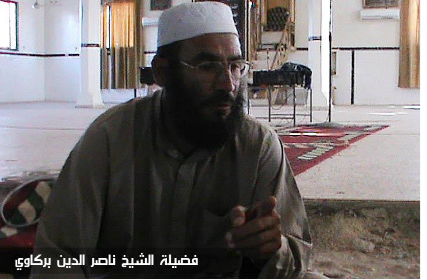
فضيلة الشيخ ناصر الدين بركاوي

الشرع و الشارع : لن نرضى بون قتل أطفالنا و نساءنا و دهر مساجدنا حاكها ندعو له في خطبنا .