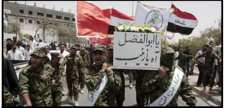
مقاتل عراقي شيعي قتل في القصير أثناء مساندة لقوات الأسد

منذ جاءت جحافل قوات من تسمى بفيلق القدس وقوات أبو الفضل العباس وحزب الله ومن أتى معهم من كافة أرجاء المعمورة للحرب ضد الثوار في سوريا دخلوا حاملين معهم شعاراتهم الطائفية التي أتت للانتقام للحسين ولزينب وما يسمونه تارات الحسين ولم يعد سراً أن دخولهم للحرب في سوريا هو للانتقام من أحفاد الأمويين وما يطلقون عليه زوراً وبهتاناً مظالم بني أمية وقد أعلنوا ذلك مراراً، وقد رفع مقاتلو حزب الله ومن شايعهم رايات مكتوب عليها (ليبيك يا حسين) فبعد رفع راياتهم في مسجد بني أمية في دمشق، رفعوها فوق مئذنة مسجد عمر بن الخطاب رضي الله عنه في مدينة القصير المحتلة والمستباحة من قبلهم ومن قبل ميليشيات بشار الأسد، وفوق مسجد خالد بن الوليد في حمص والآن في منطقة القلمون، وقد بدا هؤلاء في أشربة الفيديو الذي يبثونها على مواقعهم وفضائياتهم الحاقدة وهم بحالٍ من النشوة الطائفية ويؤكد مراقبون أن حزب الله تعمّد تسريب هذه المقطع لإيصال رسالة أنّ حربه في سوريا هي حرب عقديّة بامتياز وأنه يقوم بأداء الدور الذي رسمته له إيران على مدى أكثر من عشرين عاماً، ويبدو أنّ إيران هي الأخرى أرادت أن توصل للمجتمع الدولي رسالةً أخرى سياسية مفادها أن السيطرة في سوريا أصبحت لها وأن بشار الأسد ونظامه ما هما إلا واجهة لها في بلاد الشام، وأنّ من يريد التحدث بشأن راهن ومستقبل سوريا والمنطقة برمتها فعليه أن يدق بابها.