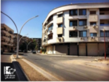
جانب من الإضراب في منطقة تنظيم كفرسوسة