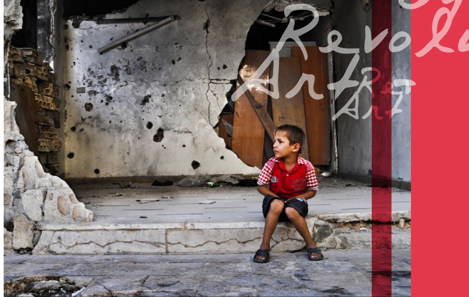
Syrian Revolution - Photography

وكان مؤسفاً أن تطفح الأثنية في أداء بعض الدول التي تتابع مسارات الثورة السورية. والتي دفع أداؤها الخاطيء إلى تفاقم الوضع في الداخل السوري. وتشتت قوى الثورة والمعارضة . وبات السوريين مهددين بإبادة منظمة للشريحة الكبرى من الشعب السوري. بعد أن استفاد النظام المجرم من الاضطراب في مواقف الدول التي يفترض أنها الداعمة لقضية الشعب السوري. ولم يكن مقبولاً من أية دولة بنيت على منظومات قيم إنسانية أن تتصرف