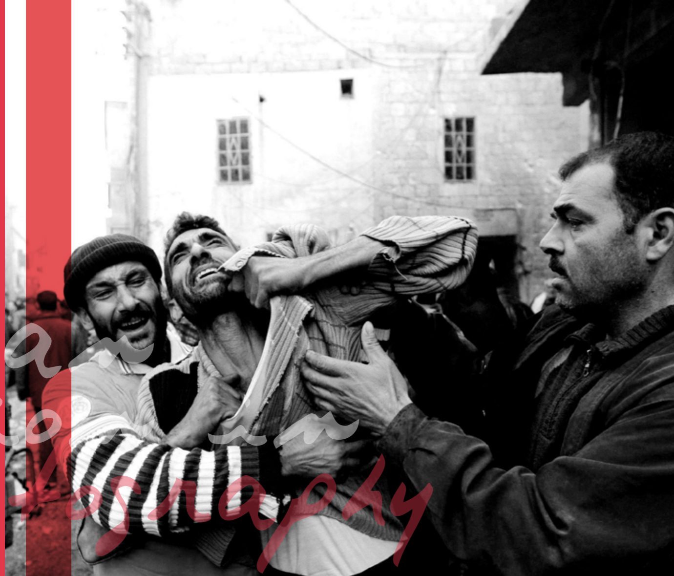
Syrian Revolution - Photography

لا شك أنهم يعتقدون الآن أن وقع الحياة كله هكذا في البلدان كلها. وأن الأطفال كلهم يجتازون مثلهم يوماً هكذا امتحان. لا يسع من تفتحت عيناه ومداركة الأولى بعد 2011 أن ما يشهده لم يجر مثله في أي بقعة من العالم إلا ما ندر.