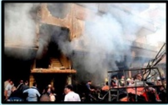
صورة لتفجيرات جرمانا في دمشق

اجتماع اول لائتلاف المعارضة ... وتفجيرات في جرمانا