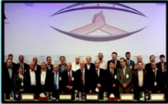
الائتلاف الوطني ينشد حكومة انتقالية

على الرغم من اكملت العسكرية التي يشنها النظام بالمدفعايات والطيران اكرهي على معظم المدن السورية استطاع (المركز السوري المستقل لإحصاء الاحتجاجات) توثيق أكثر من ٢٢٦ مظاهرة في ١٨١ نقطة تظاهر وذلك في جمعت (اقتربت الساعة وأن الانتصار).