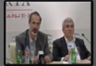
الشيخ معاذ الخطيب رئيس الائتلاف الجديد

اتفقت العديد من القوى المعارضة السورية في الداخل والخارج وعلى رأسها المجلس الوطني السوري على تشكيل كيان موحد تنضوي تحته أغلب الأحزاب والقوى المعارضة ، واتفق على تسميته هذا الكيان الجديد ( الائتلاف الوطني لقوى الثورة والمعارضة السورية) الهيئة العامة للثورة السورية - لجان التنسيق المحلية - المجلس الثوري لعشائر سورية - رابطة العلماء السوريين - اتحادات الكتاب-المنتدى السوري للأعمال-تيار المواطنة - تحالف معا - الكتلة الوطنية الديمقراطية السورية-المكون التركماني - المجلس الوطني الكردي - المجالس المحلية - الشخصيات الوطنية - المجلس الوطني السوري - المنبر الديمقراطي) ، وقد تم انتخاب الداعية السورية المعارض أحمد معاذ الخطيب كرئيس لهذا الائتلاف الجديد . ويذكر أن الخطيب من مواليد دمشق ١٩٦٠م وقد عرف بنشاطه للمعارض للنظام السوري ، وتم اعتقاله عدة مرات كان آخرها أوائل العام الجاري . وعلى الصعيد الاقليمي والدولي اختزفت الجامعة العربية بالائتلاف الوطني السوري ممثلًا شرعياً لتطلعات الشعب السوري. وفي ذات السياق دعى الأمين العام للجامعة العربية نيبال العربي، دعى الاتحاد الاوروبي للاعتراف بالائتلاف السوري المعارض ودعمه، وذلك في الكلمة التي القاها امام الاجتماع العربي الاوروبي المشترك.