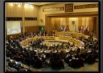
الجامعة العربية كانت اول المعترفين بالائتلاف الجديد