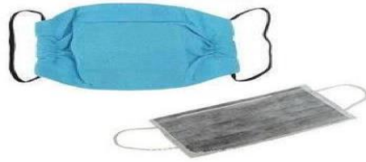
وضعه في قطعة قماش شاش أو متشقة