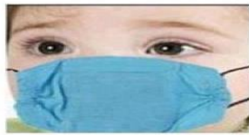
تبليله بالماء ووضعه على الفم و الانف